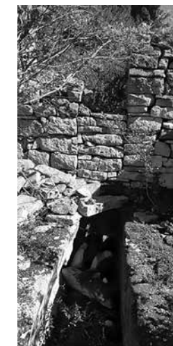
Prilog 9. Ispražnjeni svetački grob u memoriji (2020.)