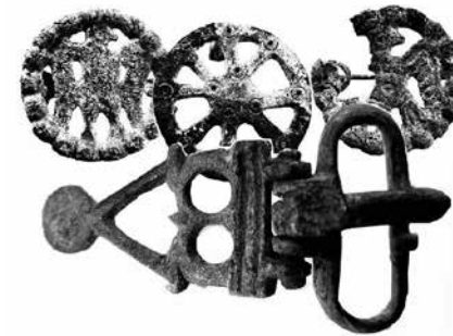
Prilog 7. Kopče iz spiljice na Majsanu, u prvom planu kopča Korint E6, Pomorski muzej Orebić, foto Ivan Pamić (2020.)