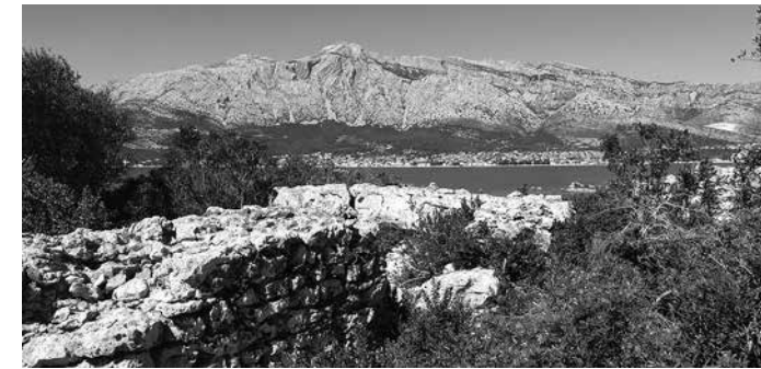
Prilog 6. Pogled s utvrde na Stražici prema Pelješcu i Orebiću