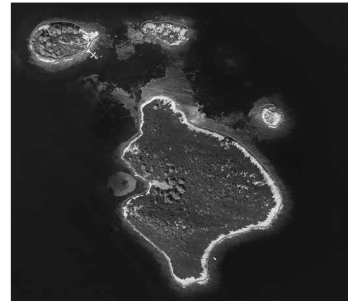
Prilog 2. Rekonstrukcija obale Majsana i okolnog otočja prije 2000 godina (podloga Arkod dostupno na http://preglednik.arkod.hr/ ), izradio Ivan Pamić 2020.