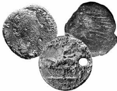
Prilog 4. Numizmatički nalazi iz rimskog doba, Faustina Starija, Janova glava/rostrum i bordelska markica, Pomorski muzej Orebić (2020.)