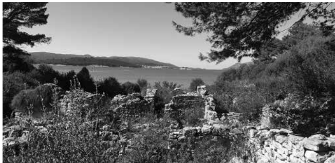
Prilog 5. Ruševine na Majsanu s pogledom na grad Korčulu