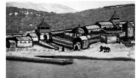
Prilog 8. Rekonstrukcija građevinskog kompleksa uoči pohoda Petra II Orseola 1000. godine, izradio Ivan Pamić 2019.