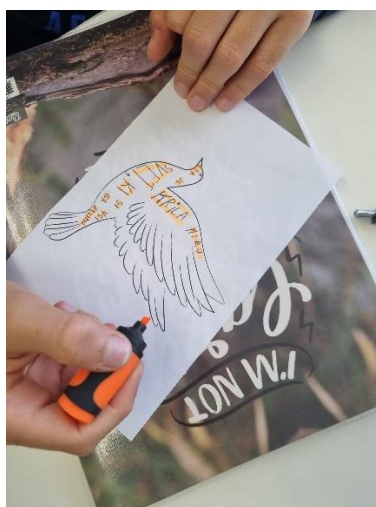
Slika 2: Učenik piše poruku za mir

O važnosti tolerancije i mira razgovarali smo s učenicima na satovima odjeljske zajednice u 6. razredu te u 7. i 9. razredu, gdje smo u 9. razredu napisali svoju poruku povodom Svjetskog dana mira, a u 6. i 7. razredu ukasili učeničku ploču porukama za mir koje su učenici napisali na papirnatim golubicama.