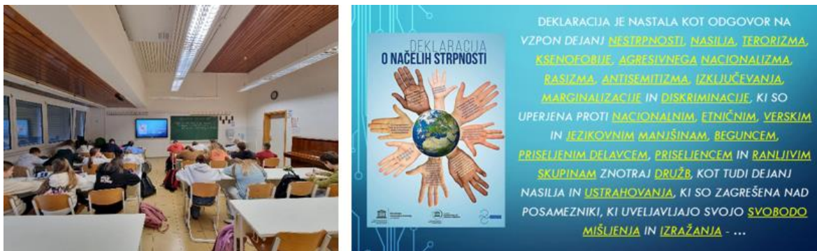
Slika 1: Čitanje deklaracije u 7. razredu

O važnosti tolerancije i mira razgovarali smo s učenicima na satovima odjeljske zajednice u 6. razredu te u 7. i 9. razredu, gdje smo u 9. razredu napisali svoju poruku povodom Svjetskog dana mira, a u 6. i 7. razredu ukasili učeničku ploču porukama za mir koje su učenici napisali na papirnatim golubicama.