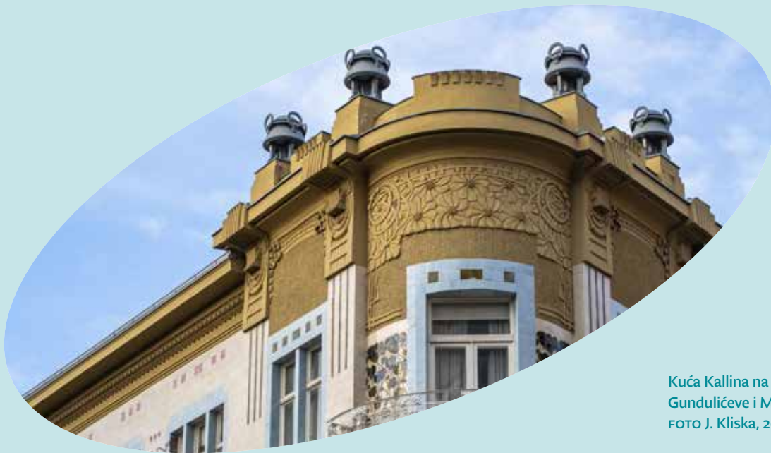
Kuća Kallina na uglu Gundulićeve i Masarykove ulice FOTO J. Kliska, 2023.