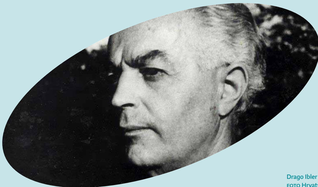
Drago Ibler (1894. –1964.)