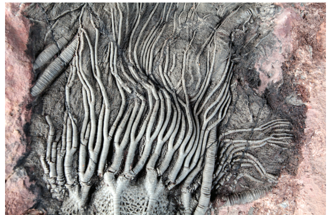
Sl. 3 Detalj morskog ljljana, Scyphocrinites sp., (Zbirka fosilnih beskralježnjaka)

uspostavimo veze između genotipa i fenotipa te od fenotipa do okoliša. Ponovljeno uzorkovanje populacija koje su dobro uzorkovane u prošlosti pomoći će u identificiranju specifičnih fenotipskih promjena. Detaljni povijesni zapisi o biotičkim i abiotskim uvjetima mogu se usporediti sa sadašnjim uvjetima kako bi se procijenile promjene u okolišu koje su mogle izazvati promjene u fenotipu. Paleontološke zbirke također se mogu upotrebljavati za proučavanje evolucijskih promjena tijekom vremena. Upotreba fosilnih i subrecentnih uzoraka omogućuje procjenu fenotipskih i genotipskih promjena tijekom dugih razdoblja kao odgovor na dramatične i produljene promjene okoliša. I morfološka i genetička istraživanja moguća su na fosilnim i subrecentnim uzorcima.