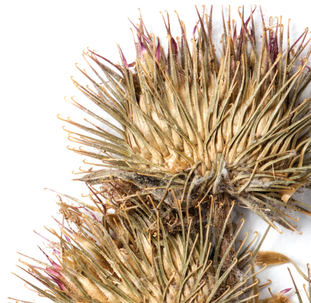
Sl. 2 Detalj velikog čička, Arctium lappa L. , (Zbirka višeg bilja)