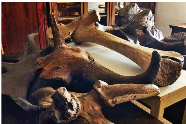
Sl. 1 Fosili ledenog doba (Zbirka fosilnih kralježnjaka)

U Muzeju Slavonije prirodoslovni primjerci prikupljeni gotovo od samog osnutka Muzeja 1 važni su primarni izvori iz kojih možemo iščitati povijest razvoja kolekcionarstva i prirodoslovlja na području Slavonije i Hrvatske, priču o taksonomskoj znanosti i neiscrpoj ljudskoj želji za razumijevanjem života na Zemlji. U Prirodoslovnom odjelu Muzeja 2 čuvaju se neprocjenjive zbirke prirodnina u kojima su sabrani predmeti čije veličine variraju od nekoliko mikrona veličine muzejskih štetnika do kostiju mamuta, uključujući sisavce, ptice, gmazove, biljke i kukce te zbirke jedinstvenih fosila i minerala.