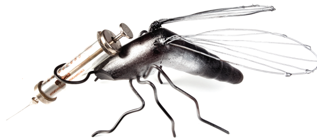
Sl. 4 Model komarca, (Zbirka prirodoslovnih učila)

u moćne istraživačke alate omogućujući znanstvenicima da testiraju povijesne hipoteze o okolišu i provedu različite studije u rasponu od javnog zdravlja i sigurnosti u studijama zdravlja okoliša i epidemiologije; proučavaju biomimetički dizajn, gdje prirodne arhitekture i sustavi nadahnuju tehnološke inovacije; 7 analiziraju drevne genotipove; do globalnih i lokalnih promjena (praćenje promjena u fenotipu kroz vrijeme) – nešto što baza podataka pukih opažanja vrsta ne može omogućiti.