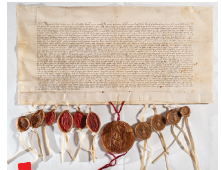
DADU, Arhiv Dubrovačke Republike, Višegradska povelja (ugovorna isprava ugarsko-hrvatskog kralja Ludovika I, kojom utvrđuje vrhovnu vlast ugarsko-hrvatskih kraljeva nad Dubrovnikom kao gradom Dalmacije uz uvjete dogovorene s dubrovačkim poslanicima, 27. svibnja 1358.

Registar (popis) vodi se od 1995. godine i trenutačno ga čini 496 fondova, zbirki ili pojedinačnih dokumenata iz cijelog svijeta, sačuvanih na različitim tvarnim nosačima. Oni su prema utvrđenim kriterijima programa ocijenjeni kao jedinstveni i važan doprinos svjetskoj baštini te su stekli pravo upisa u Registar i time postali priznata sastavnica dokumentarne baštine čovječan-