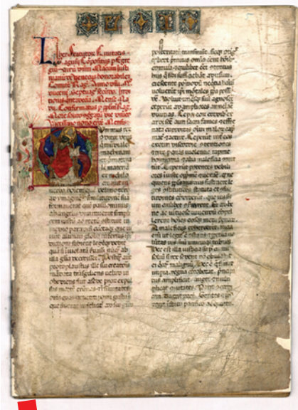
DADU, Arhiv Dubrovačke Republike, Prva stranica Statuta grada Dubrovnika iz 1272. godine. Inicijal likom svetog Vlaha, prijepis iz 15. stoljeća

Registar (popis) vodi se od 1995. godine i trenutačno ga čini 496 fondova, zbirki ili pojedinačnih dokumenata iz cijelog svijeta, sačuvanih na različitim tvarnim nosačima. Oni su prema utvrđenim kriterijima programa ocijenjeni kao jedinstveni i važan doprinos svjetskoj baštini te su stekli pravo upisa u Registar i time postali priznata sastavnica dokumentarne baštine čovječan-