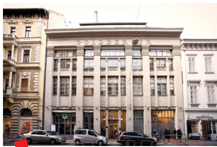
Arhiv Otvorenog društva © Daniel Vogel, grafički dizajner

Arhiv Otvorenog društva osnovan je 1995. godine, od kada je postao jedan od najvećih svjetskih dokumentarnih centara o povijesti Hladnog rata, o tranziciji srednje i istočne Europe iz državnog socijalizma u demokraciju te o pokretima za ljudska prava i teškim kršenjima ljudskih prava diljem svijeta. Također je mjesto čuvanja dokumenata Zaklade Otvoreno društvo (OSF), uključujući Sorosevu jugoslavensku zakladu i nacionalne ogranke OSF-a koji su nastali u državama sljednicama Jugoslavije tijekom 1990-ih. Ne manje važno, OSA je i arhiv Srednjoeuropskog sveučilišta, a također posjeduje i manji broj dokumenata o Međusveučilišnom centru u Dubrovniku, gdje je rođena ideja o Srednjoeuropskom sveučilištu.