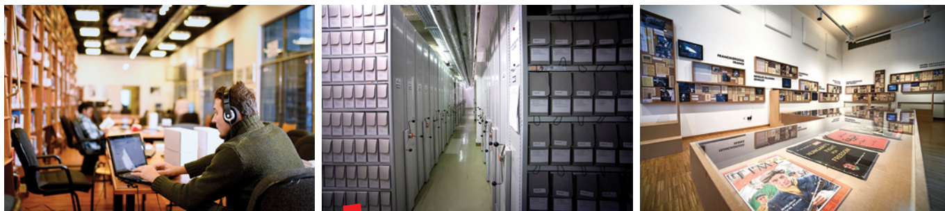
Arhiv Otvorenog društva © Daniel Vegel, grafički dizajner

podržavaju ranije pokrenute projekte Arhiva. U široj javnosti najpoznatiji takav projekt je Verzió, međunarodni filmski festival dokumentarnog filma o ljudskim pravima, kojeg je Arhiv pokrenuo prije više od dva desetljeća i koji je postao najveći festival te vrste u regiji.