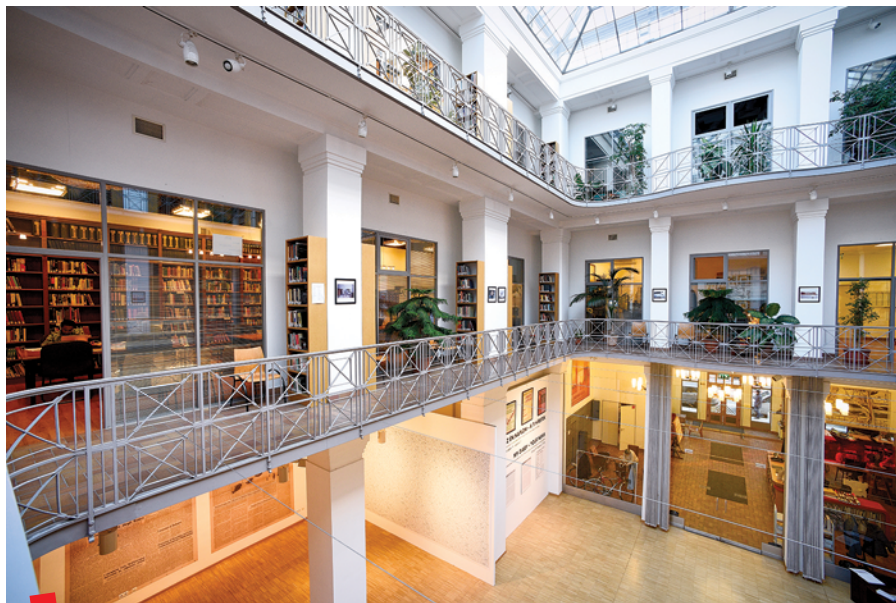
Arhiv Otvorenog društva © Daniel Vegel, grafički dizajner

Uz potporu stipendija iz programa Višegradske grupe, koji su 2010. godine osnovali OSA i Višegradska fondacija, oko 300 znanstvenika, istraživača, umjetnika i novinara do danas je uživo u Budimpešti provodilo arhivska istraživanja u trajanju do dva mjeseca. Arhiv Otvorenog društva je počašćen i zahvalan na mogućnosti predstavljanja u časopisa @rhivi te ćemo se potruditi da se redovito vraćamo s ažuriranjima o našem radu u onome što smatram jednom od najzujbudljivijih arhivskih institucija u regiji, pa čak i u svijetu. ■