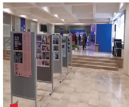
THEY: LIVE izložba na Sveučilišnoj smotri 2023.