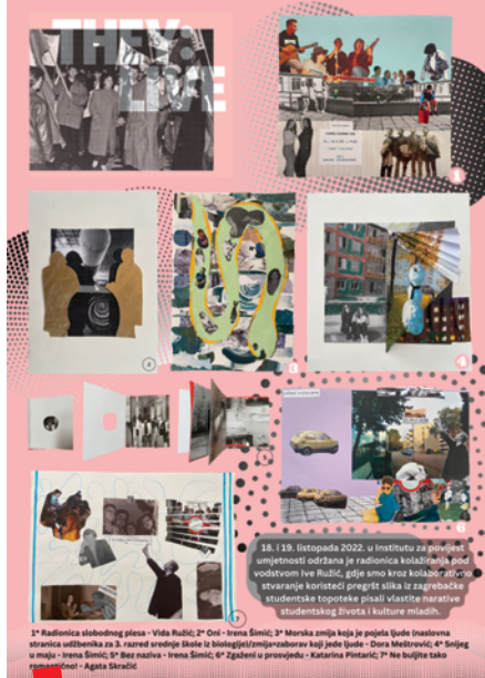
THEY: LIVE radionice u Zagrebu 2022.

Slijedom ove izložbi u u jesen 2023. organizirana je nova izložba „Studentski život u Zagrebu“ koja je predstavljena na Studentskoj smotri, zajedno s popratnim katalogom. U Suradnji sa Sveučilištem u Zagrebu, izložbu se planira predstaviti i na pojedinim sastavnicama Sveučilišta, uz popratni program (radionice i okrugli stolovi na temu studentskog života nekad i sad). Suradnici i autori predstavljenih priloga koji su se odazvali pozivu za podjele