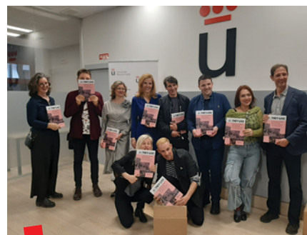
Predstavljanje THEY: LIVE publikacije u Madridu, 22. ožujka 2023.