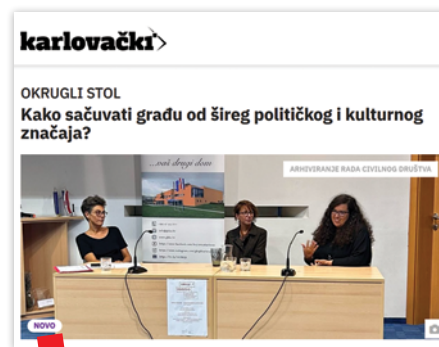
Press clipping