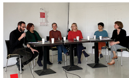
Konferencija u Zagrebu, panel rasprava