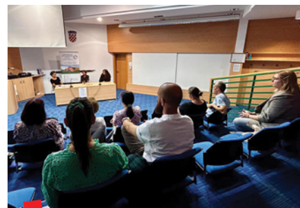
Okrugli stol u Karlovcu