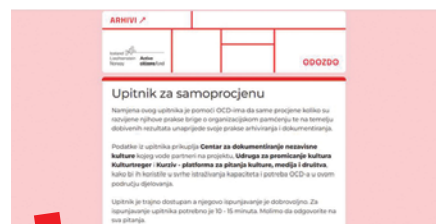
Upitnik za samoprocjenu