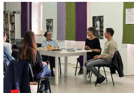
Okrugli stol u Puli

Kada su udruge Kurziv i Kulturtreger 2011. godine pokrenule Centar za dokumentiranje nezavisne kulture u prostoru kluba Booksa u Zagrebu, učinile su to upravo radi slabe dostupnosti te neadekvatnog čuvanja i propadanja fizičkih materijala koji svjedoče o dugogodišnjoj bogatoj produkciji izvaninstitucionalne kulturne scene u Hrvatskoj. Od tada Centar radi kao fizičko i virtualno mjesto sustavnog prikupljanja, obrade, katalogizacije, digitalizacije i prezentacije gradiva te funkcionira kao arhiv zajednice koji se gradi suradnjom i razmjenom znanja. Kolaborativni model rada pritom je i garancija njegove održivosti, jer su razmjena resursa i suradnja nužni u situaciji financijske nestabilnosti i podkapacitiranosti organizacija.