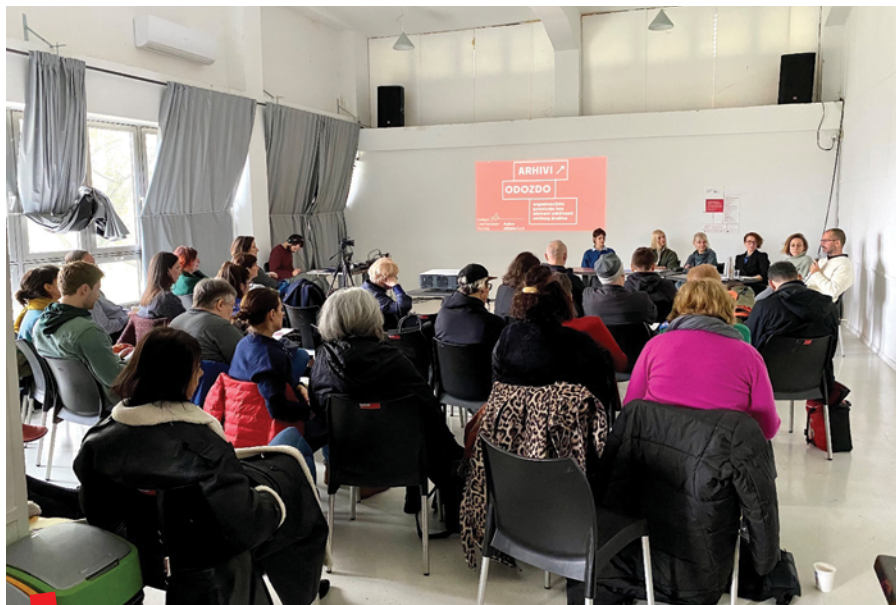
Konferencija u Zagrebu, panel rasprava

U tom prvom razdoblju, zagovarački napori platforme rezultirali su prepoznavanjem važnosti rada na sustavnom prikupljanju i čuvanju arhivske građe civilnoga društva u Nacionalnoj strategiji za razvoj civilnog društva za razdoblje 2017. – 2021. (nije nikada usvojena), kao i uvođenjem podrške za organizacijsko i umjetničko pamćenje 2017. godine u program Zaklade Kultura nova, koja zbog oskudnih