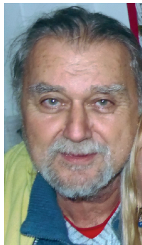
Tihi u prostorijama SO HPD-a »Željezničar« 2014. godine Autor: Vlado Božić