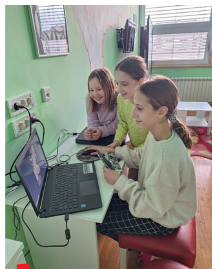
Skeniranje. Povijesna skupina 5b 2023./24.

Topoteka Ivanec – kraj i ljudi: https://ivanec.topotheque.eu/