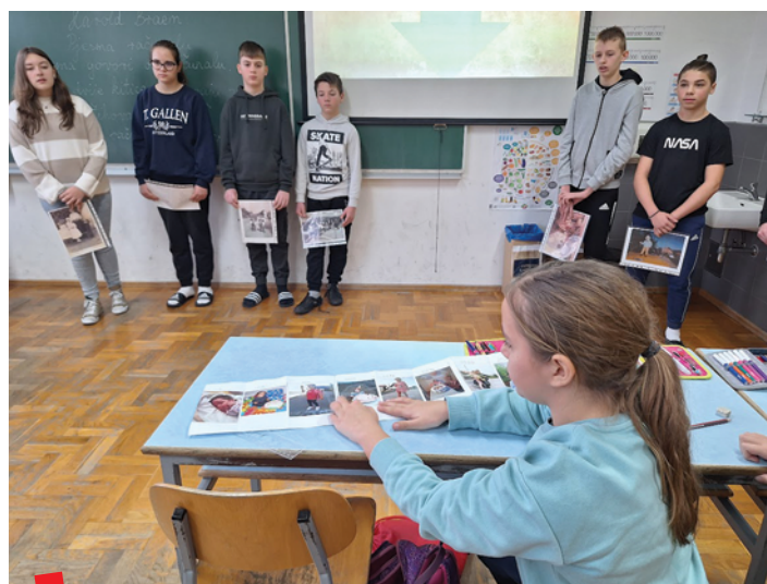
Lenta vremena - vertikalna korekcija