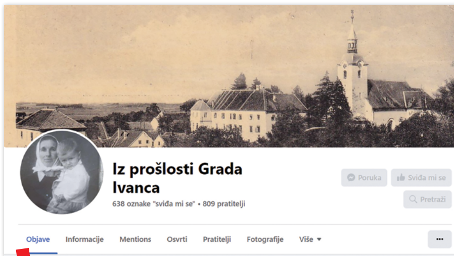
Facebook stranica Iz prošlosti Grada Ivanca

ivanečke osnovne škole. Poticale su ih i usmjeravale njihove učiteljice, a projekt je koordinirala učiteljica Povijesti Suzana Jagić. Cijele nastavne godine prikupljali su u obiteljima osobne memorabilije: uporabne predmete, stare fotografije, dokumente i različite tiskane materijale. Prikupljene memorabilije važan su izvor podataka o životu Ivančana tijekom vremena, a upoznavanje osnovnoškolske populacije s njihovom važnošću i značenjem jedini je ispravan način očuvanja vlastitog identiteta u suvremenom globaliziranom svijetu.