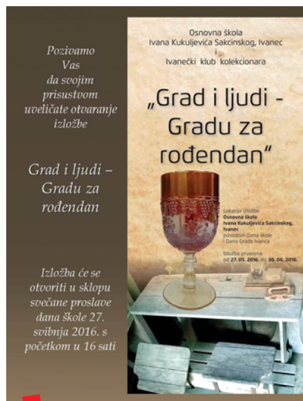
Izložba „Grad i ljudi – Gradu za rođendan“

Odbačeni predmet na tavanu ili požutjela fotografija u ladici upravo nam želi ispričati bezvremensku ivanečku priču o našim korijenima. Takvu smo priču željeli pokloniti voljenom Gradu za rođendan. Priču su 2016. započeli učenici trećih, sedmih i osmih razreda