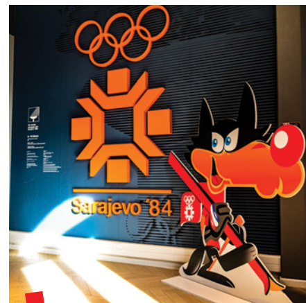
Plakat izložbe „12 dana kada smo bili centar svijeta“