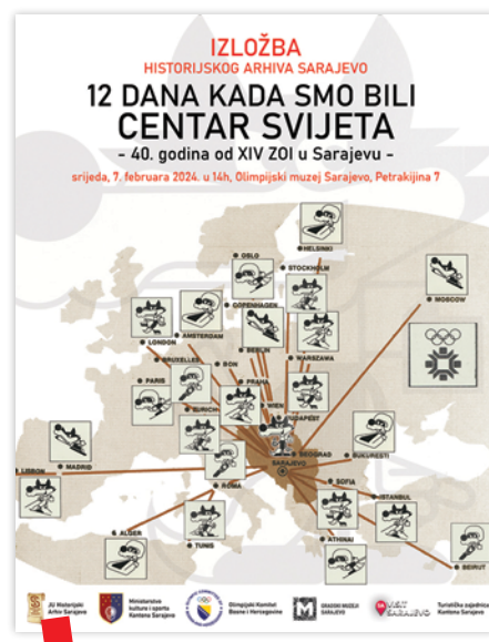
Plakat izložbe „12 dana kada smo bili centar svijeta“

Skupština grada Sarajeva, kao zakonodavno tijelo Grada, bila je vodeća snaga u borbi za dobivanje ZOI. Dokumentarna građa Grada Sarajeva čuva se u Historijskom arhivu Sarajevo pa se iz nje mogu kronološki pratiti