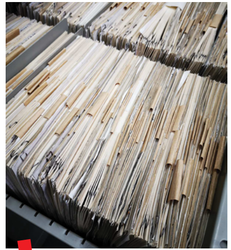
Arheološka karta Republike Hrvatske – dio prikupljene dokumentacije.

Jedan od važnih projekata Instituta za arheologiju proteklih desetljeća je „Arheološka karta Republike“ koja je prikupila opsežnu dokumentaciju (slika 1). Ti podaci činili su osnovu za stvaranje Baze antičkih lokaliteta Republike Hrvatske. Osmišljavanje projekta Baze pokrenuto 2017. godine, a Baza je dostupna na mrežnim stranicama IARH od 2018. Svakodnevno se ažurira novim objavljenim i prikupljenim podacima te upisuju novi lokaliteti. Do trenutka pisanja u Bazi je upisano 2454 antička lokaliteta. U Bazi se nalaze osnovni podaci o svakom antičkom lokalitetu, literatura koja se odnosi na njega, za dio lokaliteta dodane su fotografije, dokumenti i korisne poveznice. Na Bazi aktivno radi tim znanstvenika Instituta, djelatnice ARHINDOKSA te vanjski suradnici.