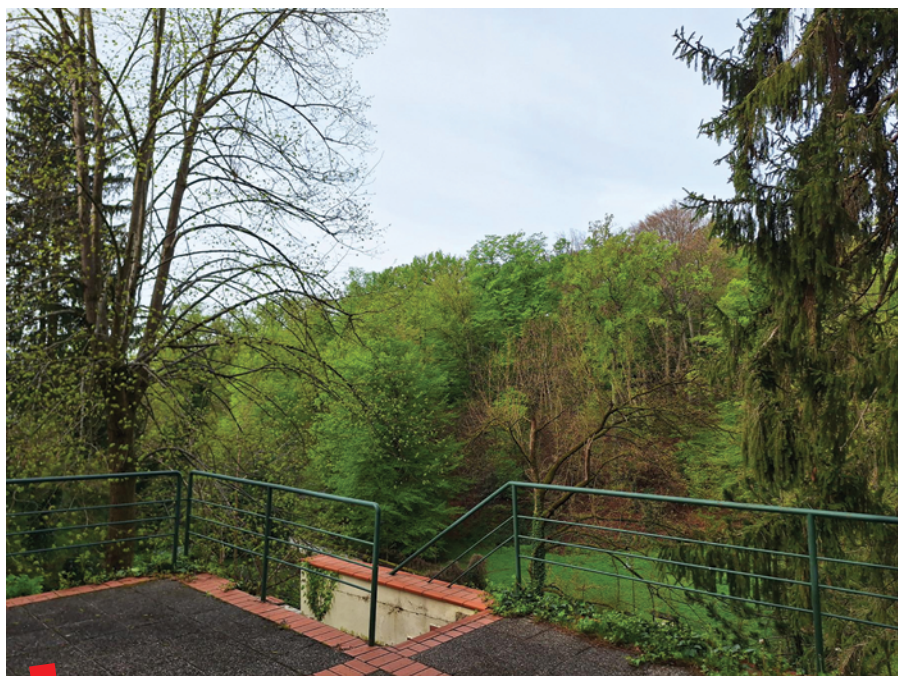
Terasa Knjižnice s pogledom na park-šumu Tuškanac

Zahvaljujući Ministarstvu znanosti i obrazovanja RH, 2023. godine Institut za arheologiju dobiva odobrenje za zapošljavanje stručne osobe koja bi bila zadužena za rad i poslovanje Knjižnice. Sve to vrijeme znanstvenici Instituta i povremeno angažirani knjižničari marljivo su vodili evidenciju pristizanja knjižne građe u inventarnim knjigama. Danas Knjižnica posjeduje četiri inventarne knjige (dvije za zbirku knjiga i dvije za zbirku časopisa), koje se i nadalje popunjavaju novo pristiglim jedinicama građe. Iz tako lijepo vođene dokumentacije može se zapaziti da Knjižnica trenutno sadrži 7639 svezaka omeđenih publikacija i 6551 svezak serijskih publikacija.