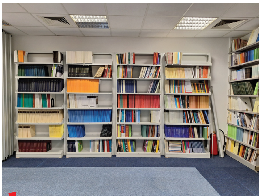
Manji dio knjižnog fonda