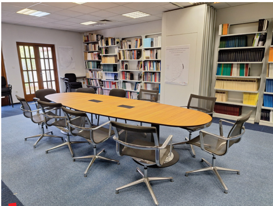
Čitaonica Knjižnice Instituta za arheologiju

Danas Knjižnica održava razmjenu publikacija sa stotinjak srodnih hrvatskih ustanova i oko 300 inozemnih. Institut za arheologiju ima svoju vlastitu nakladu pa su izdanja Instituta pronašla svoje mjesto na policama brojnih europskih knjižnica i arheoloških ustanova. Posebno valja istaknuti časopis Prilozi Instituta za arheologiju u Zagrebu koji izlazi od 1983. godine, isprva pod nazivom Prinosi Odjela za arheologiju Centra za povijesne znanosti Sveučilišta u Zagrebu , a od 1985. mijenja naziv u današnji. Malo kasnije, 2005. godine, utemeljen je časopis Annales Instituti Archaeologici – AIA (Godišnjak Instituta za arheologiju) , koji od broja IX/2013 izlazi u elektroničkom obliku. Također, tu su i Monografije Instituta za arheologiju (MIA) , Zbornici Instituta za arheologiju (ZIA) te ostale vrijedne publikacije.