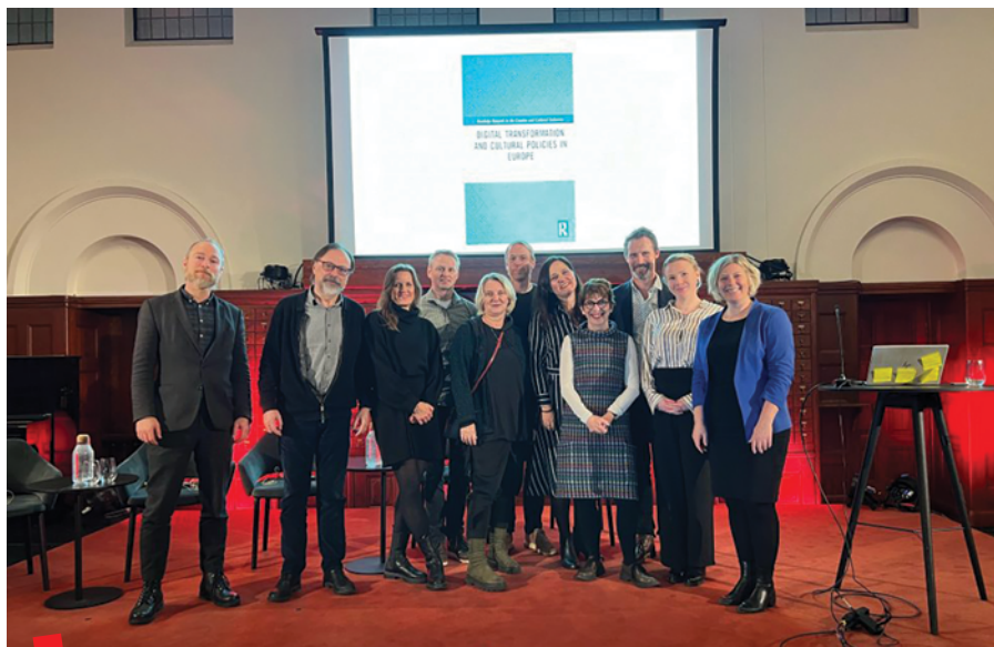
Predstavljanje rezultata projekta Rapids and backwaters u Nacionalnoj knjižnici u Oslu, studeni 2023.

U knjizi se analiziraju posljedice promjena kulturnih politika i što se događa kada ih izazove digitalna kultura. Na temelju detaljne rasprave o ključnim konceptima i analitičkim perspektivama, ova zbirka tekstova također nudi jedinstven multidisciplinarni doprinos koji pokazuje koliko je digitalna kulturna politika (hiper) konvergentna. Nove politike sadrže uvriježene ideje kulturne politike –