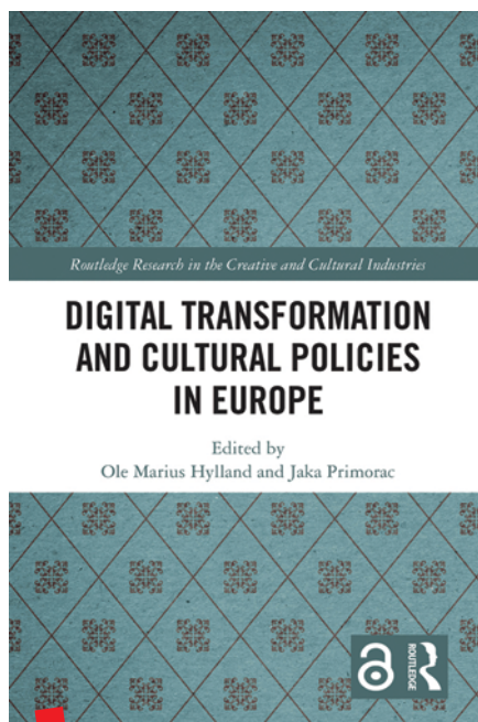
Naklada Routledge, London, 2023.

Cilj je knjige Cjelovita procjena učinka intervencija u području kulturne baštine – SoPHIA model , autorica Sanje Tišme, Aleksandre Uzelac i Sunčane Franić, doprinijeti raspravi o prikladnosti postojećih modela evaluacije projekata u području kulturne baštine te predstaviti prijedlog sveobuhvatnijeg modela, koji uključuje više različitih čimbe-