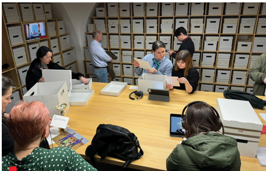
Sudionici skupa u Muzeju osobnih priča

Na zatvaranju skupa zaključeno je da se njegova vrijednost ogleda se u naglasku na kontinuiranom životu i značaju kulturne baštine u suvremenom kontekstu, ističući važnost brige, promocije i povezivanja s publikom,