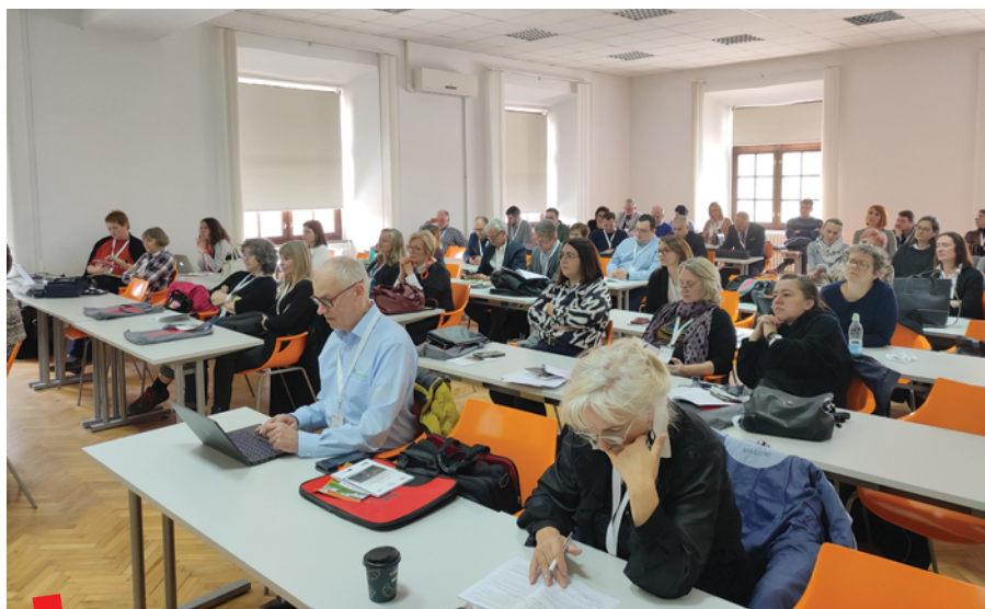
Sudionici skupa na predavanjima u prostorima Akademije za umjetnost i kulturu

kao i povezivanja među stručnjacima i institucijama. Štoviše, skup je rezultirao novim partnerstvima i idejama za projekte.