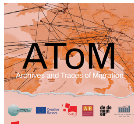
Početna stranica AToM izložbe

Facebook: https://www.facebook.com/profile.php?id=61561334499083