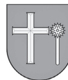
Slika 3. Grb grada Omiša

Grb grada Omiša iz 15. stoljeća sadrži križ i buzdovan. Križ predstavlja kršćanstvo i vjeru, a buzdovan borbu. Tumačenje ovog grba veže se uz dugogodišnju obranu od turskih napada pa je grb iznimno vrijedan izvoran prikaz prošlosti koji predstavlja dugovječnu samostalnost grada Omiša.