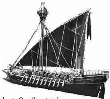
Slika 8. Omiška strijela

Posjedovali su brodice imena omiške strijele , a čuvale su se u kanjonu rijeke Cetine. Jedna od najvažnijih obilježja omiških strijela bila je plitki gaz koji im je omogućavao brzu pokretljivost, a isto tako i brzo povlačenje u korito rijeke. Vječni neprijatelj bila je Mletačka Republika s kojom su gusari ratovali.