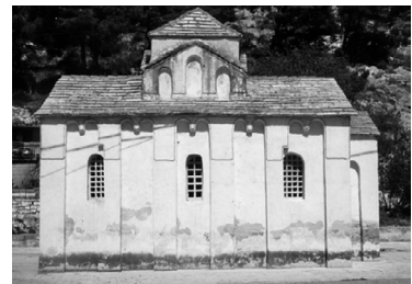
Slika 5. Crkvice sv. Petra na Priku