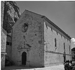
Slika 4. Župna crkva sv. Mihovila

Rješenje: Na područje Omiša otpada približno 5.8 % površine Splitsko-dalmatinske županije, gustoća naseljenosti približno je 53 stanovnika po km 2 , a žena ima nešto više nego muškaraca.