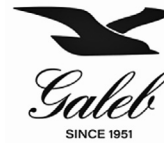
Slika 12. brand Galeb

Omiš je vrijedan pažnje i posjeta tijekom cijele godine jer nudi dosta aktivnosti, za svakoga ponešto. Vjerujem da nikad nećete zaboraviti svoj prvi susret s Omišem koji je imao burnu i uzbudljivu povijest. Savjetujem da posjetite Gradski muzej i doživite gusarsku povijest te probate mediteransku kuhinju s ribljim specijalitetima. Sretan put!