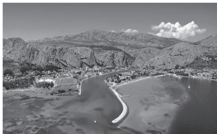
Slika 2. Panorama Omiša

Širi prostor današnjeg grada bio je naseljen već u prapovijesno doba, a u antici ga je nastanjivalo ilirsko pleme Delmati. Podrijetlo naziva grada potječe od slavenske riječi Holm/Hum, što je prevedenica ilirsko-grčke riječi Onaion/Oneon, a znači brijeg, brdo odnosno mjesto na brijegu.