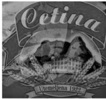
Slika 11. Tjestenina Cetina

Valja napomenuti i gospodarski značaj grada Omiša. U Omišu se nalazi poznata tvornica tjestenine „Cetina” osnovana 1922. godine te tvornica rublja „Galeb” osnovana 1951. godine.