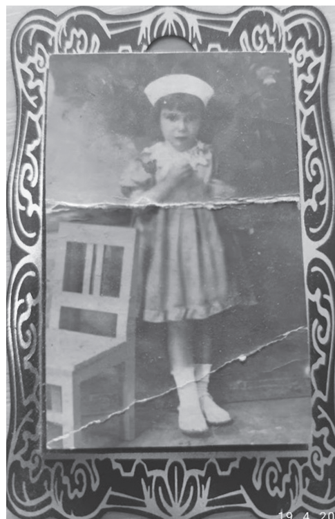
SLIKA 3. Rosetta prilikom odlaska oca na ruski front

Prvo bombardiranje Rijeke dogodilo se 7. siječnja 1944. godine, 27 američkih bombardera B17 bacilo je oko 350 bom-