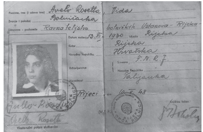
SLIKA 6. Službenička knjižica

U doba kad je bila u dječjoj bolnici (1948. – 1951.), radila je na odjelu za TBC kostiju i tada je radila kao jedina sestra bolničarka na tom odjelu (Slika 6.).