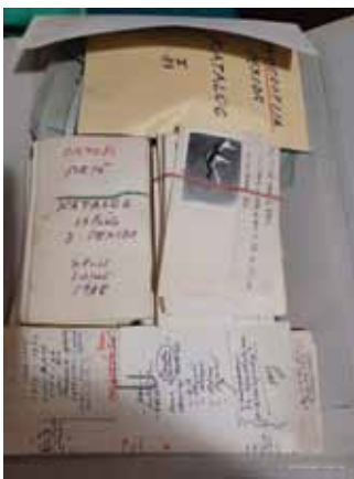
Slika 1. Arhivsko gradivo iz ostavštine Matka Peića

Povjerenstvo koje je pregledalo arhivsko gradivo raspoređeno u kutije različitih veličina te najlonske vrećice, procijenilo je ukupni opseg na 300 arhivskih kutija, što odgovara mjeri od 30 dužnih metara građe. Zbirka ujedno sadrži i osobne predmete Matka Peića i njegove supruge Višnje Jagić Peić, kao i dijelove namještaja i tehniku. Još na početku svog rada Povjerenstvo je zaključilo kako je od presudne važnosti da cjelokupna ostavština akademika Matka Peića bude pohranjena na jednom mjestu s obzirom na to da njegov značaj daleko nadilazi regionalne okvire.