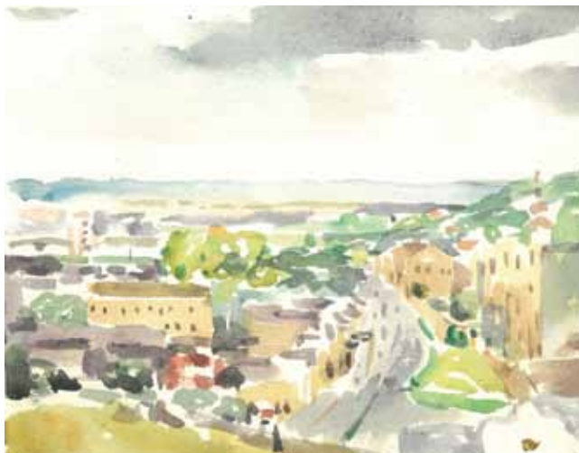
Slika 3. Matko Peić: Požega s Kalvarije, akvarel, 1961.

dine Matko Peić bio je redovni sveučilišni profesor povijesti umjetnosti na Akademiji likovnih umjetnosti u Zagrebu. Svestranost u istraživanju odvela ga je na Filozofski fakultet u Zagreb gdje je 1971. godine doktorirao s tezom iz povijesti književnosti »Barok i rokoko u djelu Antuna Kanižlića«. Doktorski rad posvetio je svom ocu i majci.