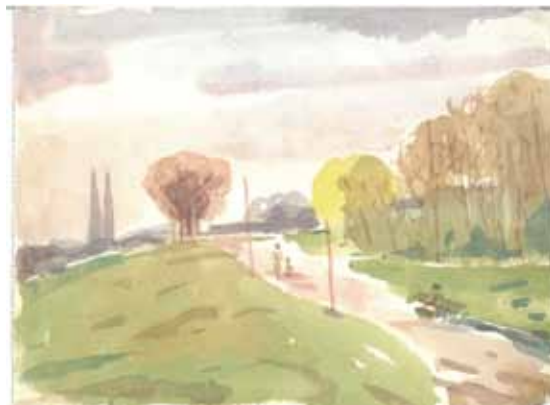
Slika 12. Matko Peić: Zagreb 1960., akvarel

europskog grada. On nije bio samo izvrstan analitičar, nego i majstor sinteze, ovisno što je i na koji način želio prezentirati, ali i doprijeti do promatrača, čitača ili slušatelja, u čemu mu je neosporno pomogao i dar britkog likovnog pedagoga.