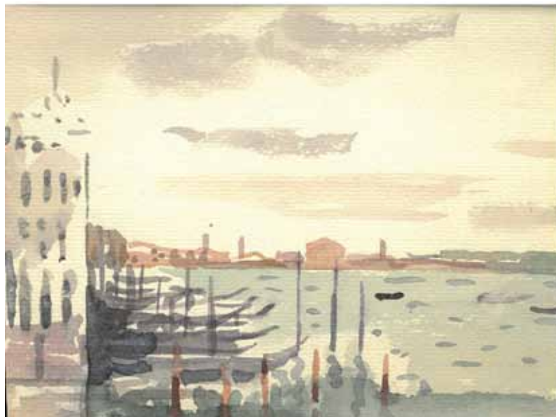
Slika 6. Matko Peić: Venecija, 1966., akvarel