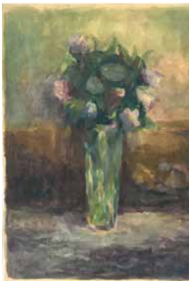
Slika 4. Matko Peić: Cvijeće u vazi, 1951., gvaš