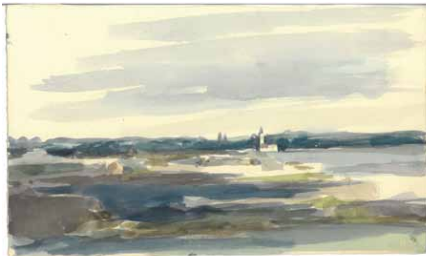
Slika 8. Matko Peić: Zima u Turopolju, 1952., akvarel

New Yorku povijest umjetnosti, što do otkupa ostavštine nije bilo poznato, ali govori o zajedničkom interesu dvoje intelektualaca i supružnika koji su cijeloga života bili nerazdvojni. Čak i kada su se sudski rastali, živjeli su u istom stanu, dopisivali su se ispod vrata, ali su i posjećivali značajna događanja, putovali, imali zajedničke prijatelje i ljetovali zajedno kod rodbine.