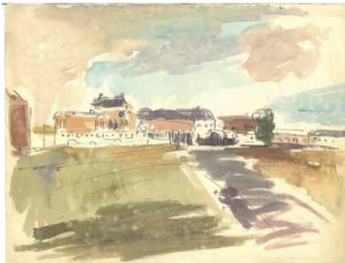
Slika 5. Matko Peić: Versailles, 1954., akvarel

Nakon što je doktorirao 1971. godine Matko Peić predstavio se Požežanima i svom rodnom gradu Požegi svojom prvom izložbom likovnih radova, pejzaža, a izložbu su mu organizirali „Požeški list“ i Historijski arhiv u prostoru Gradske knjižnice u Požegi. Matko je tada najavio i svoju drugu izložbu u Požegi 1972. godine, ali s temom mrtve prirode, koja se nikada nije održala, tako da su njegove mrtve prirode zajedno s drugim temama izložene tek 2009. godine u požeškom Gradskom muzeju.