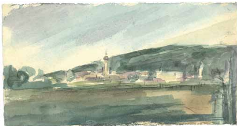
Slika 2. Matko Peić: Požega, 1953., akvarel