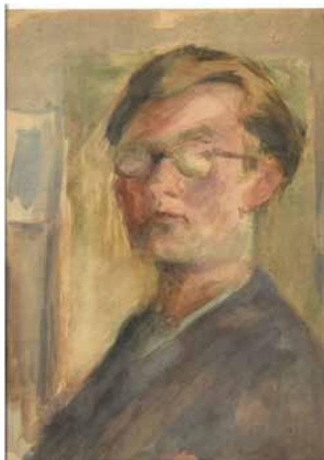
Slika 1. Matko Peić: Autoportret, 1946., gvaš