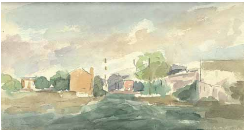
Slika 13. Požega, 1952., akvarel

Požega je otkupljenom ostavštinom akademika Matka Peića u fundusu Gradskog muzeja Požega i darovanom ostavštinom akademika Dubravka Jelčića, koja je pohranjena u Zavodu za znanstveni i umjetnički rad HAZU-a, stvorila zajedno s muzejom, arhivom, knjižnicom, kazalištem, te obrazovnim ustanovama zaista respektabilan razvojni kulturni potencijal za budućnost. Na taj je potencijal Matko Peić cijeloga života neprestano ukazivao, posebno svojom rečenicom: »Ja sam Požega«.