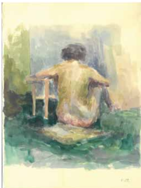
Slika 10. Matko Peić: Akt žene, 1950., akvarel

Prigoda otvorenja ove izložbe bila je posebna jer su se u iznimno lijepom i osvjetljenom prostoru nove požeške knjižnice mogla vidjeti po prvi puta neka od Peićevih likovnih djela, knjige s posvetama poznatih osoba s kojima je prijateljevao i konačno ambijent, u kojemu dominira Matko kao stvaran, zagrljen brdom knjiga na policama u svojoj radnoj sobi za pisaćim stolom, priborom za rad i njegovim na vješalici ostavljenim balonerom i crnim kišobranom. Činilo se kao da je tek otišao u drugu sobu. Sam ambijentalni postav, knjige i slike činile su se kao da su bile postavljene onako kako bi ih postavio on sam.