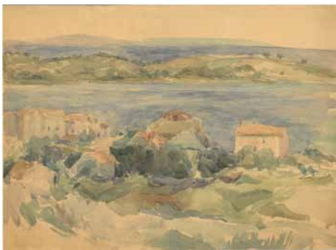
Slika 9. Matko Peić: Novalja, 1948., akvarel

Tijekom izložbe „Povratak u Požegu“ Zavod za znanstveni i umjetnički rad HAZU-a u Požegi, Grad Požega i Gradski muzej Požega organizirali su 3. 3. 2023. godine znanstveni skup o akademiku Matku Peiću u prostoru nove Gradske knjižnice u Požegi.