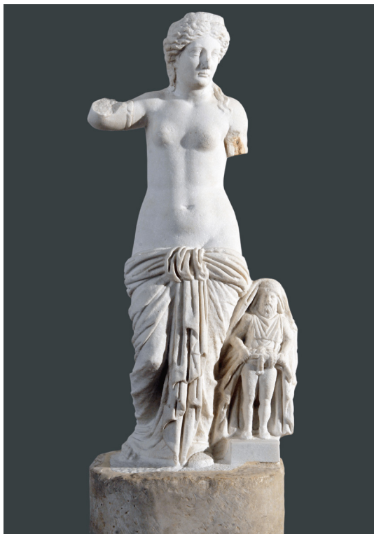
Slika 2. Kip Venere Anzotike i Prijapa, Arheološki muzej u Splitu, inv. br. AMS-38100 (T. Seser)

zajednice. Dakako, treba priznati da je možda bio izabran i zbog toga što je njegova prisutnost, ovisno o promatraču i njegovim individualnim preokupacijama, u određenoj mjeri naglašavala sve navedeno, no njegov odnos s Venerom nikako ne može biti direktno uspoređen s vezama Izide i Ozirisa ili Kibebe i Atisa kako M. Suić naglašava, 56 budući da su navedeni božanski parovi supružnici čiji je odnos ljubavne i seksualne prirode, dok je odnos Venere prema Prijapu isključivo majčinske naravi. 57 U svakom slučaju, razvidno je da su Venera i Anzotika kao božanstva povezivana s reprodukcijom, plodnošću i stvaranjem bile srodnog mitološkog karaktera te da je on omogućio integraciju njihovih kultova i posljedično zajedničko štovanje sve do trenutka kada je Venera u potpunosti zasjenila, a potom i zamijenila Anzotiku.