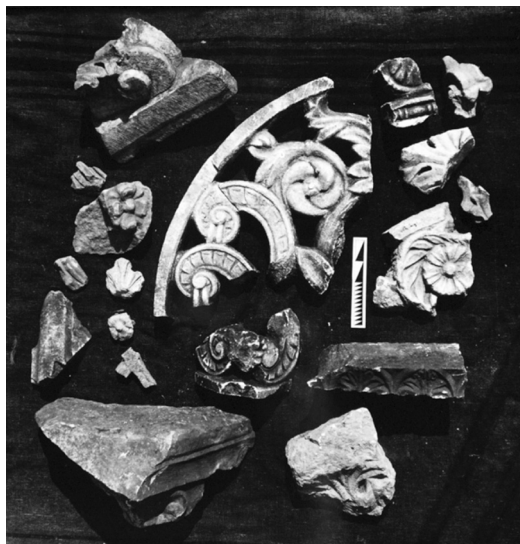
Slika 3. Ulomci arhitektonske dekoracije hrama kod Porta Andetria

Sustipanu, 89 gdje su možda dopremljeni s Malog hrama. 90 Imajući na umu ove podudarnosti, razvidno je da su pri koncepciji i ukrašavanju svih nabrojanih građevina djelovali arhitekti i klesari iz iste graditeljske radionice.