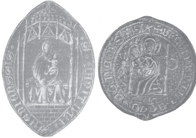
Slika 3. Veliki i mali pečatnjak Senjskog kaptola