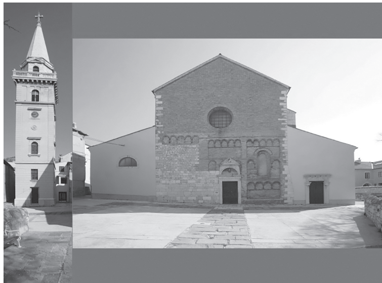
Slika 1. Senjska katedrala Uznesenja BDM sa zvonikom – sjedište Senjske biskupije i Senjskog kaptola