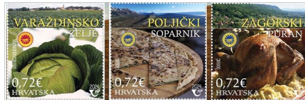
Sl. 2. Poštanske marke s obilježjima hrvatskih poljoprivrednih i prehrambenih zaštićenih proizvoda u Europskoj uniji

de, šumarstva i ribarstva, 2025). Stoga se toga datuma obilježava Dan zaštićenih hrvatskih autohtonih proizvoda. Povodom toga, Hrvatska pošta izdala je seriju poštanskih marki pod nazivom „Hrvatski zaštićeni poljoprivredni i prehrambeni proizvodi“ (sl. 2). Godine 2024. dio te serije bili su Poljički soparnik / Poljički zeljanik / Poljički uljenjak, Varaždinsko zelje i Zagorski puran (Program ruralnog razvoja, 2024). Posljednji proizvod koji je stekao ovu zaštitu jest Ludbreški hren, a to se dogodilo 3.4.2024. god. (Ministarstvo poljoprivrede, šumarstva i ribarstva, 2025).