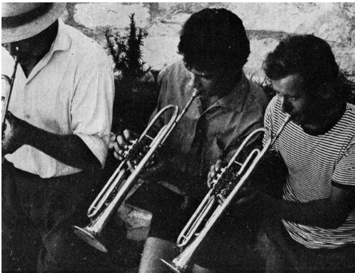
Priprema Ferrarijeve 'narodne svečanosti' u Veloj Luci 1968. (Čelić 1968: 35)

Za razliku od tradicionalne glazbe, u kojoj zapis služi kao tekst za izvedbu i tumačenje karaktera djela u glazbi, u ovom slučaju partitura ispunjava samo sporednu funkciju: služi kao pomoć pri slušanju i razumijevanju glazbe.