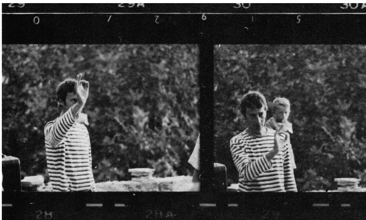
Luc Ferrari daje znak za početak happeninga (Čelić 1968: 48)