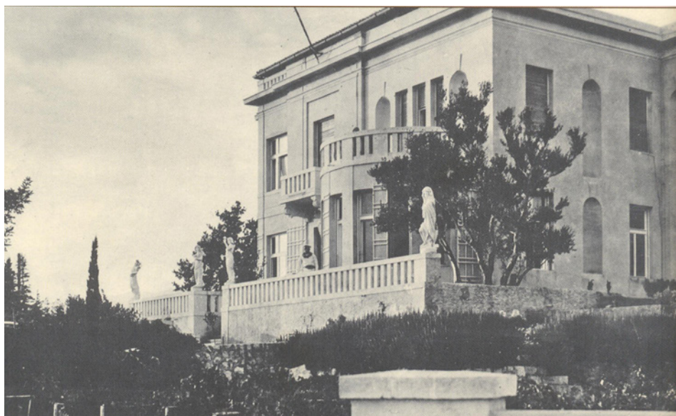
Selce, vila Odilon

Nema podataka o tome zašto je Helena Odilon odustala od gradnje ljetnikovca u Zatonu i odlučila mjesto za svoj odmor i oporavak potražiti u Hrvatskom primorju. Jedan od razloga mogle su biti administrativne poteškoće oko dobivanja potrebnih dozvola za gradnju. Na ovu bi pretpostavku upućivala jedna kratka notica koja se pojavila u onodobnom tisku, a u kojoj stoji da se dubrovački sud u nekoj pravnoj stvari koja se tiče Helene Odilon proglasio nenadležnim zato što ona posjeduje mađarsko državljanstvo. Ali možda je za promjenu plana važniju ulogu imala blizina Zagrebu ili bolje poznavanje lokalnih prilika, no sve su to samo spekulacije za koje u izvorima za sada nema potvrde. Jedino što se pouzdano zna jest da je Helene Odilon već 1910. godine kupila dva gradilišta u Selcu, jedno na selačkoj Punti za gradnju privatne vile, a drugo na putu prema Crikvenici za gradnju sanatorija. Ideja je bila dobro zamišljena i vjerojatno je potekla od spretnog i poduzetnog Bele Pečića – vila je trebala služiti bračnom paru za stanovanje, a sanatorij za njihovo uzdržavanje i otplatu bankovnih zajmova. Izradu planova za obje građevine bračni par Odilon-Pečić povjerio je riječkom arhitektu Vladimiru Vlatku Vidmaru, koji se već ranije afirmirao u Selcu, projektiravši skladnu vilu Šalda, okruženu parkom, nedaleko od mjesta predviđenog za sanatorij. 11 Gradnja dvaju obje-