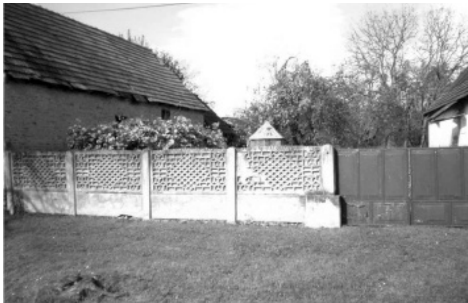
Slavonska kuća s prostranim dvorištem