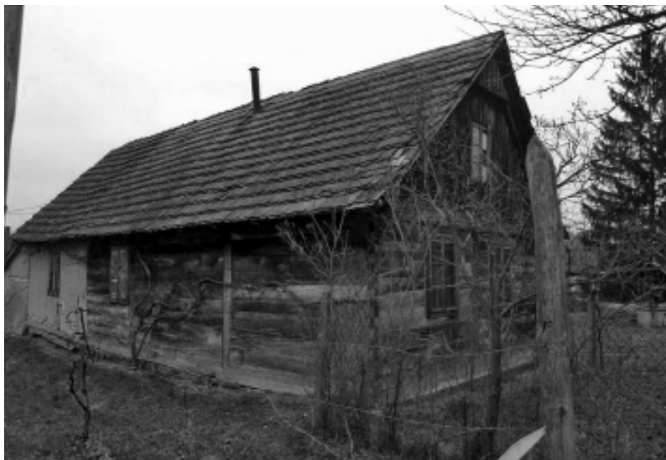
Drvena prizemnica, složena od drvenih blokova