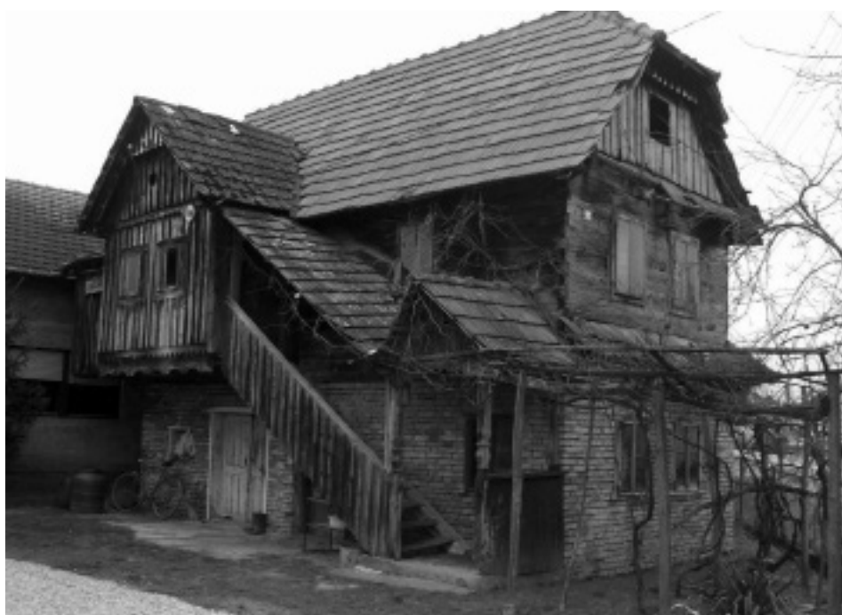
Posavska kuća, s čardakom