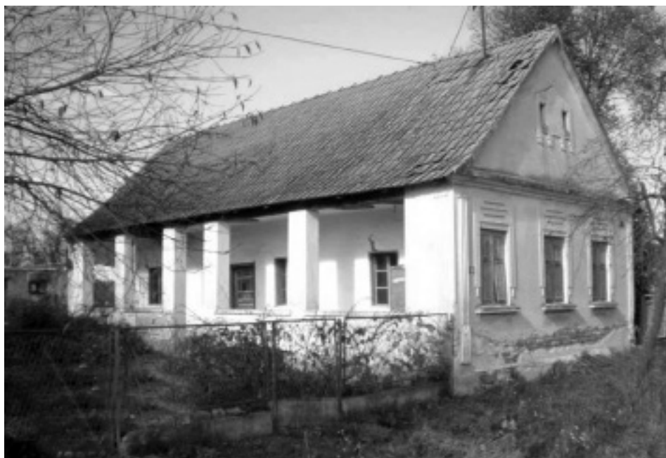
Slavonska kuća s gankom