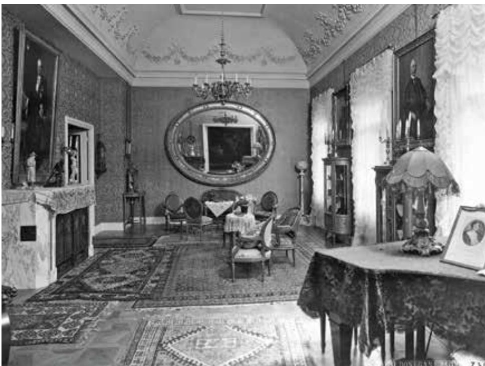
Slika 14. Hugo Donegany, vila Ehrlich-Marić, južni salon (prizemlje), oko 1928.