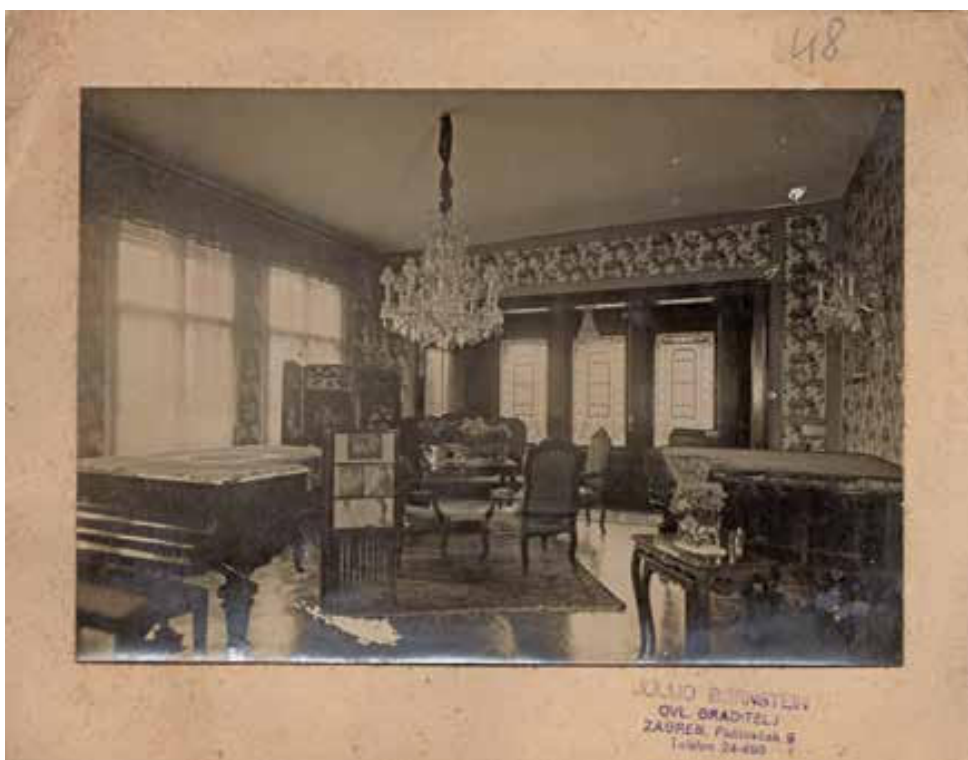
Slika 12. Glazbeni salon vile Vrbančić, oko 1930. Izvor: Muzej za umjetnost i obrt, inv. oznaka MUO 52006.

Figure 11. Dining room of the Vrbančić villa, before 1927. Source: Edo Šen, Arhitekt Viktor Kovačić: Mapa-monografija (Zagreb: self-published, 1927), tabl. XVII.