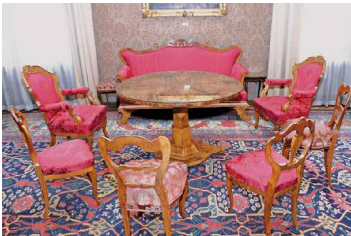
Slika 8. Komadi namještaja u velikom salonu palače HAZU: stol iz dvorca Poznanovec (?), dio garniture za sjedenje iz stana Dore Kauders-Kostrenčić (sofa, dva naslonjača i dva stolca) te dva stolca (od sedam) iz stana Dore Kauders-Kostrenčić.

Figure 8. Furniture pieces in the big salon of the Academy Palace: table from Poznanovec Castle (?), part of a furniture set from Dora Kauders-Kostrenčić's apartment (sofa, two armchairs, and two chairs) and two chairs (out of seven) from Dora Kauders-Kostrenčić's apartment.