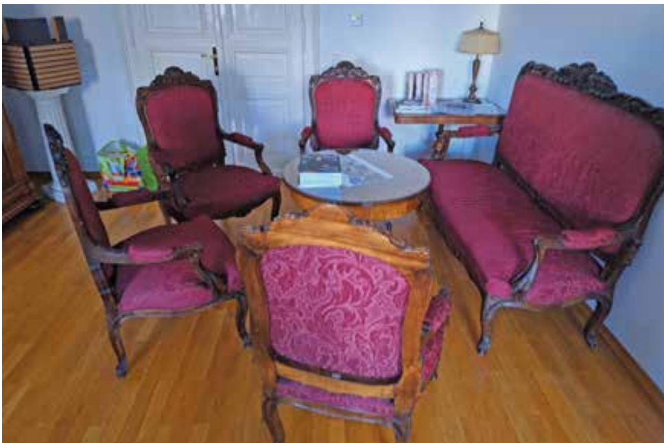
Slika 13. Garnitura za sjedenje iz glazbenog salona vile Vrbanić. Figure 13. Seating set from the music salon of the Vrbanić villa.