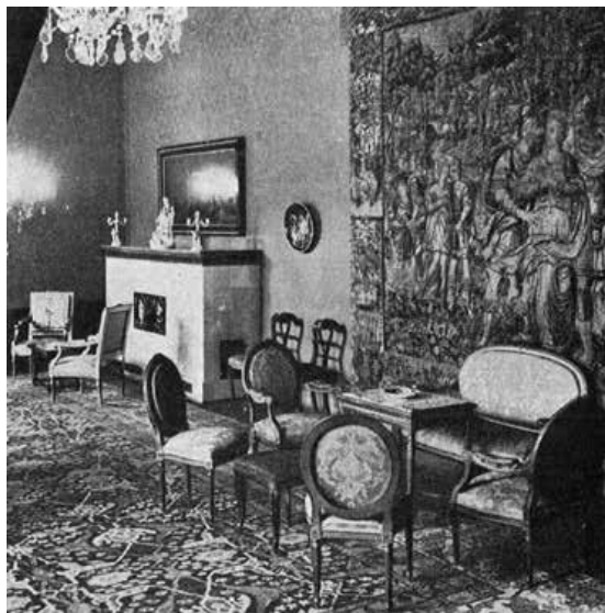
Slika 16. Salonska garnitura iz južnog salona vile Ehrlich-Marić u velikom salonu palače Akademije, prije 1952.

Opsežna građa nastala djelovanjem Komisije za sakupljanje i očuvanje kulturnih spomenika i starina tijekom druge polovice četrdesetih godina 20. stoljeća pokazala se – osobito u proteklih nekoliko godina pojačanih istraživanja – kao još naveliko neiscrpljeno vrelo podataka o provenijenciji umjetnina, starina i dru-