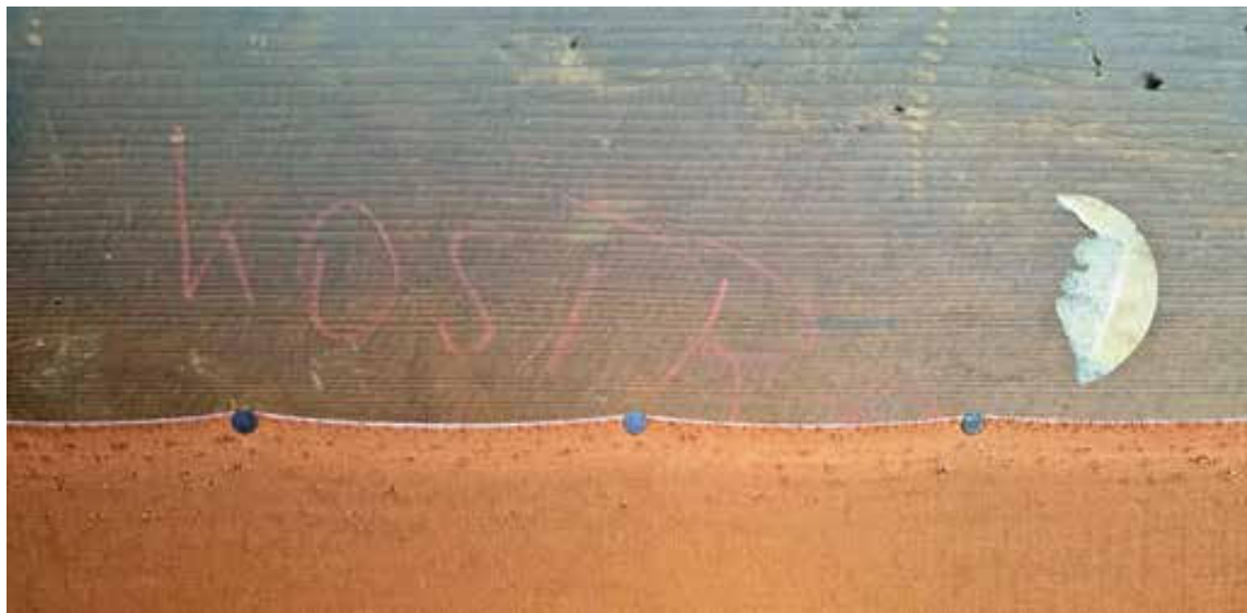
Slika 9. Bilješka Kostr[enčić] na leđima sofe (sa slike 8) iz stana Dore Kauders-Kostrenčić. Fotografirao Ivan Ferenčak, 2024.

Figure 9. Note Kostr[enčić] on the back of the sofa (from Figure 8) from Dora Kauders-Kostrenčić's apartment. Photographed by Ivan Ferenčak, 2024.