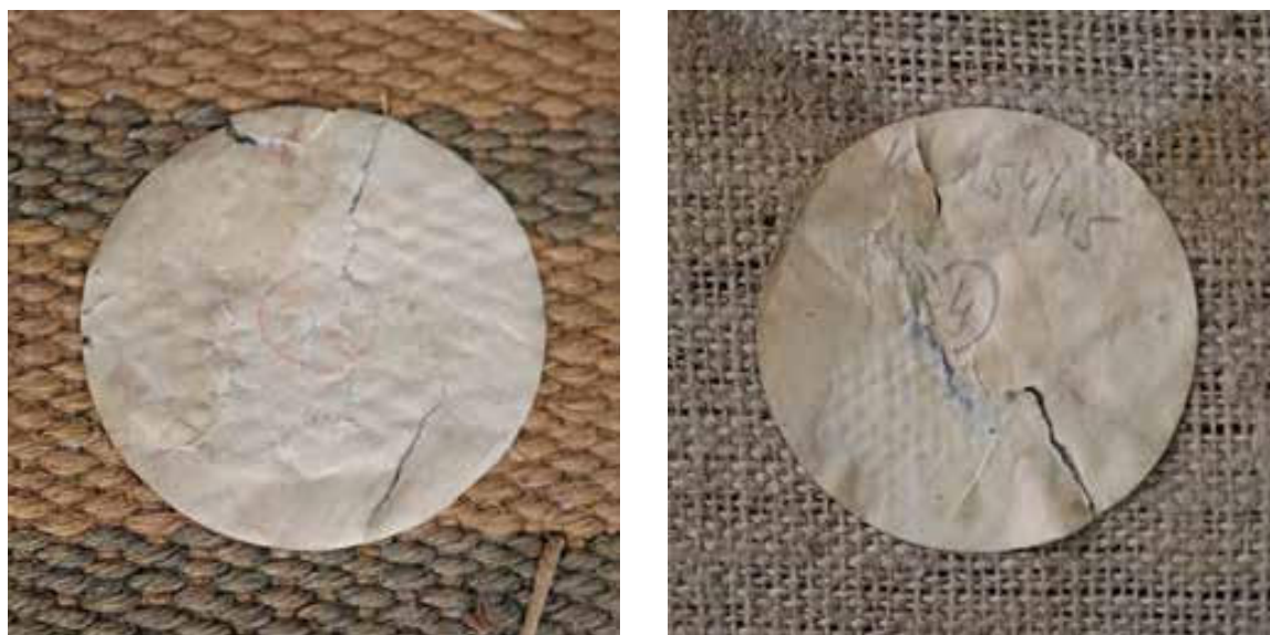
Slika 7. Oznake KOMZA-e na stolcima iz dvoraca a) Poznanovec i b) Bežanec. Fotografirao Ivan Ferenčak, 2024.

Figure 7. The Commission's markings on chairs from the castles a) Poznanovec and b) Bežanec. Photographed by Ivan Ferenčak, 2024.