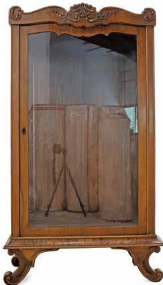
Slika 10. Vitrina iz stana Dore Kauders-Kostrenčić, dio garniture (sa slike 8).

Figure 10. Display cabinet from Dora Kauders-Kostrenčić's apartment, part of the furniture set (from Figure 8).