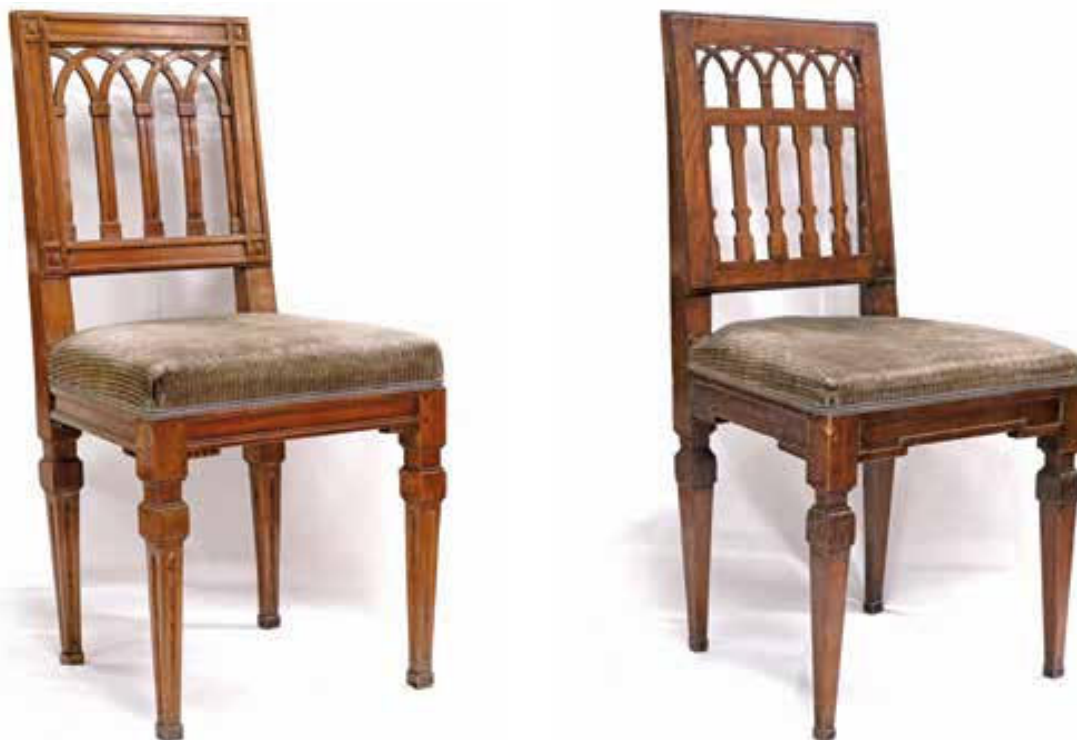
Slika 6. Stolci iz dvoraca a) Poznanovec i b) Bežanec.