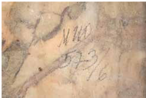
Slika 15. Brojčana oznaka na donjoj strani mramorne ploče stola salonske garniture iz južnog salona vile Ehrlich-Marić. Fotografirao Ivan Ferenčak, 2024.

Figure 15. Numerical marking on the underside of the marble tabletop of the salon seating set from the southern salon of the Ehrlich-Marić villa. Photographed by Ivan Ferenčak, 2024.