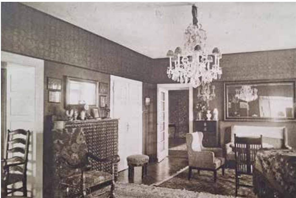
Slika 11. Blagovaonica vile Vrbančić, prije 1927. Izvor: Edo Šen, Arhitekt Viktor Kovačić: Mapa-monografija (Zagreb: vlast. naklada, 1927), tabl. XVII.

Figure 11. Dining room of the Vrbančić villa, before 1927. Source: Edo Šen, Arhitekt Viktor Kovačić: Mapa-monografija (Zagreb: self-published, 1927), tabl. XVII.