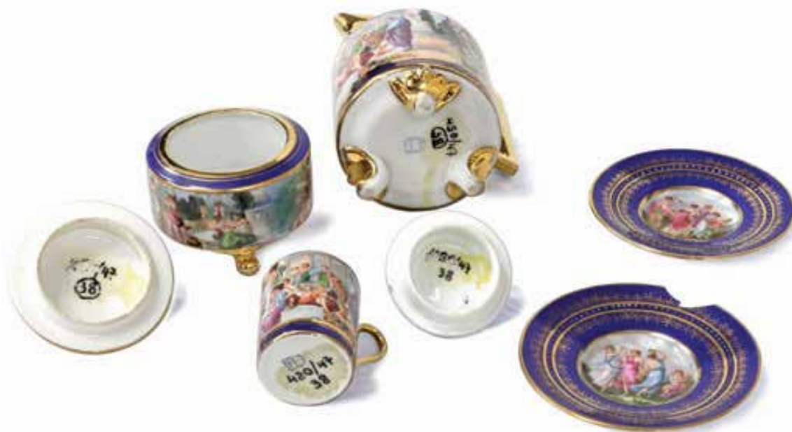
Slika 3. Dijelovi porculanskog servisa za kavu s oznakama KOMZA-e. Figure 3. Parts of a porcelain coffee set with the Commission's markings.

miji (ponajviše slika) zaokruženi crvenom bojom. Na kraju je dokumenta bilješka „okruženi brojevi [crvenom bojom] predani spisom br. 568/47 od 18. XII. 47 Jug. Akademiji znanosti i umjetnosti u Zagrebu“.