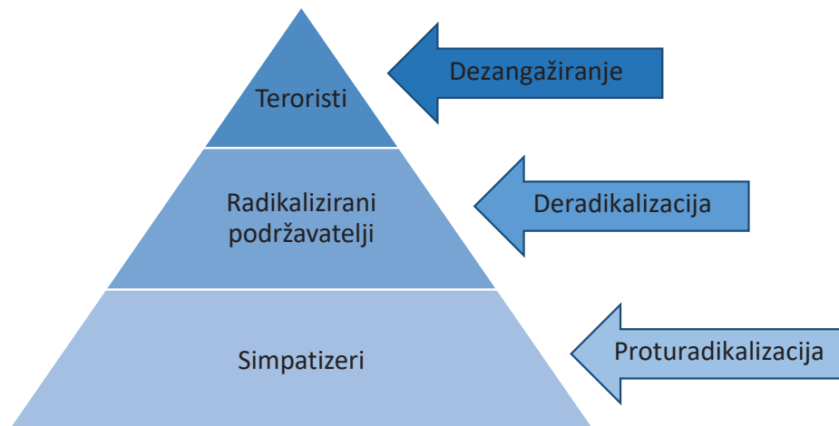
SLIKA 2. Sfere djelovanja proturadikalizacije, deradikalizacije, dezangažiranja.

dizajniranih i implementiranih s ciljem prevencije radikalizacije mladih ili drugih ranjivih skupina i zajednica u vlastitoj domovini (El-Said, 2015: 10).