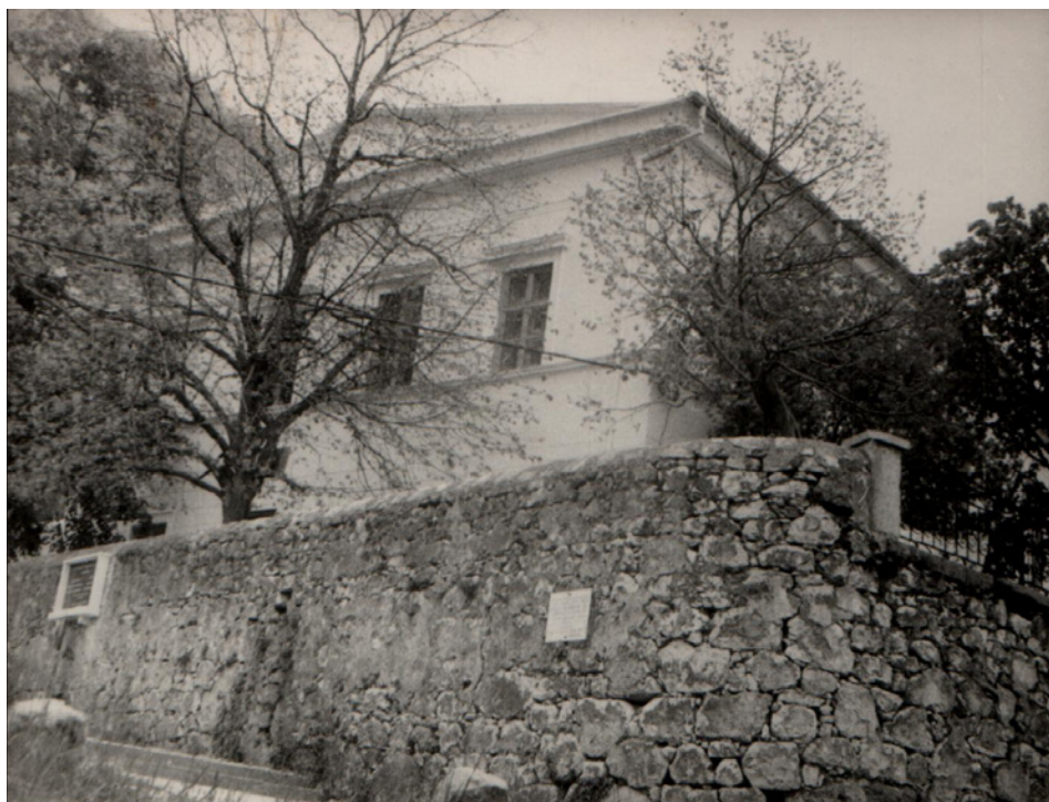
Nova školska zgrada u Grižanima

Za vrijeme potresa 1916. zgrada je bila veoma oštećena i od prve grižanske škole ostala je samo ruševina.