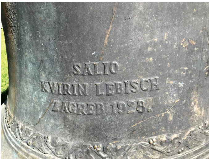
Slika 5. Župna crkva sv. Mihovila u Lovincu. Detalj s natpisom: „Salio Kvirin Lebisch Zagreb 1928.“