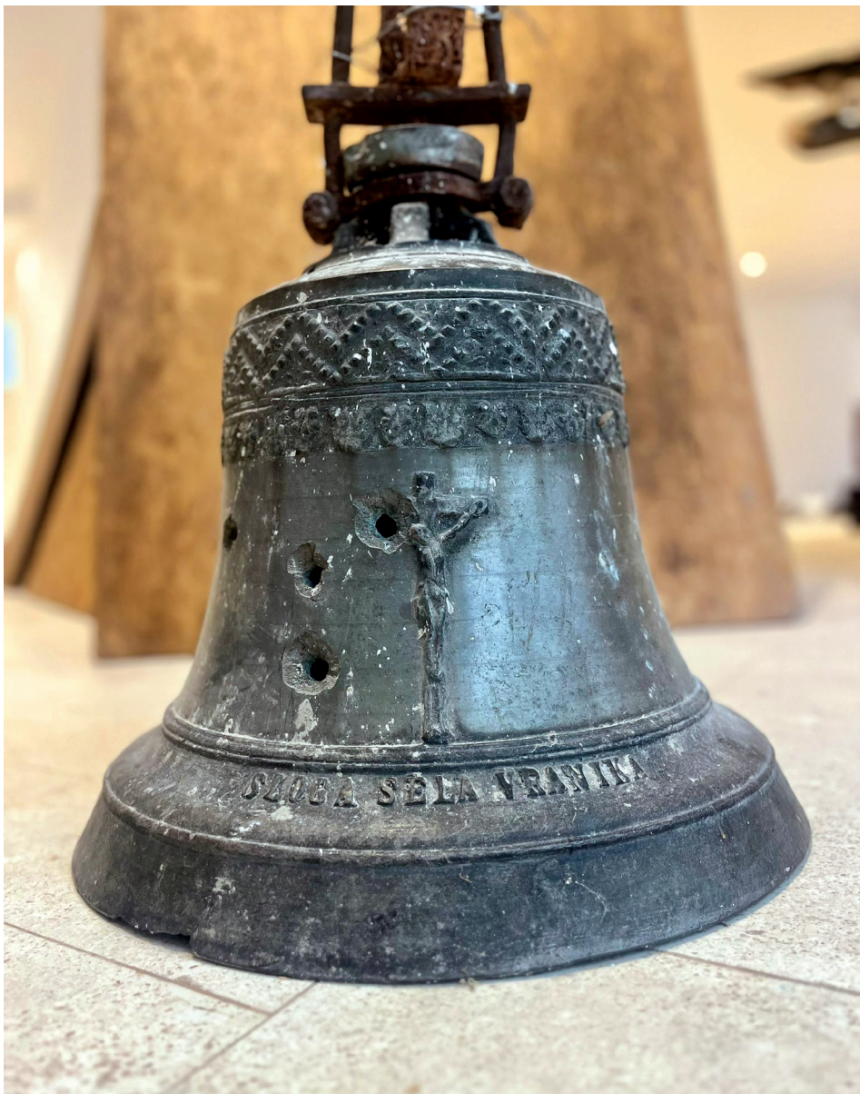
Slika 1. Zvono kapele sv. Frane u Vraniku s prikazom Raspetoga Krista i posvetom: „Sloga sela Vranika“. Muzej Crkve hrvatskih mučenika na Udbini.