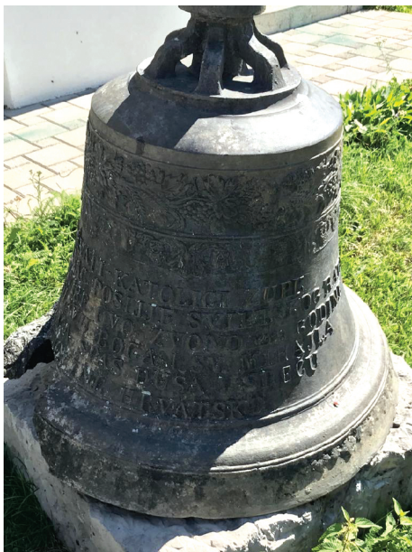
Slika 3. Župna crkva sv. Mihovila u Lovincu. Zvono u slavu Boga i sv. Mihovila.

Zvono u čast sv. Mihovila, zaštitnika crkve, župe i mjesta, ukrašeno je u gornjem dijelu dvama pojasima stiliziranih biljnih motiva simbolički povezanih s euharistijom: u gornjem redu širi se ukras lišća i grozdova vinove loze iz kojih ritmično izlaze kitice žitnoga klasja, a u donjem redu teče uži pojas stiliziranih girlandi. Ispod ukrasa se s jedne strane nalazi posveta organizirana u šest redova s tiskanim reljefno istaknutim slovima sljedećega sadržaja: „HRVATI KATOLICI ŽUPE LOVINAC POSLIJE SVJETSKOG RATA OBNOVIŠE OVO ZVONO 1923. GODINE NA SLAVU BOGA I SV. MIHAJLA ZA SPAS DUŠA