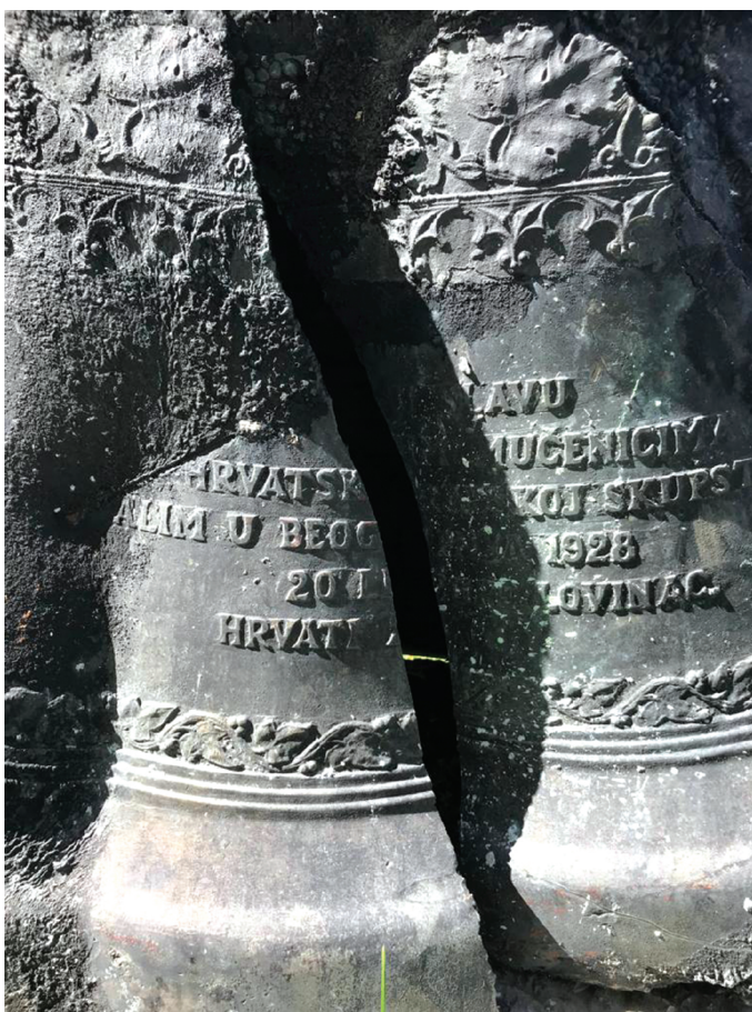
Slika 6. Detalj zvona s posvetom „Na slavu hrvatskim mučenicima palim u beogradskoj skupštini. 20. lipnja 1928. Hrvati župe Lovinac.“ Snimila T. Petrović Leš, 2022.