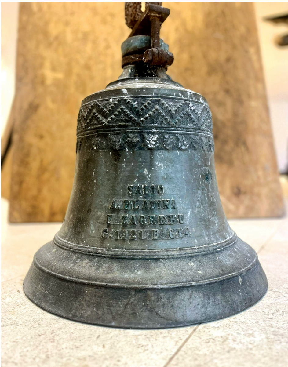
Slika 2. Zvono kapele sv. Frane u Vraniku s natpisom: „Salio A. Blazina u Zagrebu. G. 1921 B 624“. Muzej Crkve hrvatskih mučenika na Udbini.