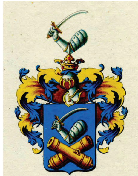
Slika 2. Plemički grb Stjepana Vrkljana