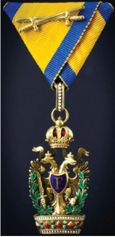
Slika 7. Red željezne krune III. klase s ratnom dekoracijom