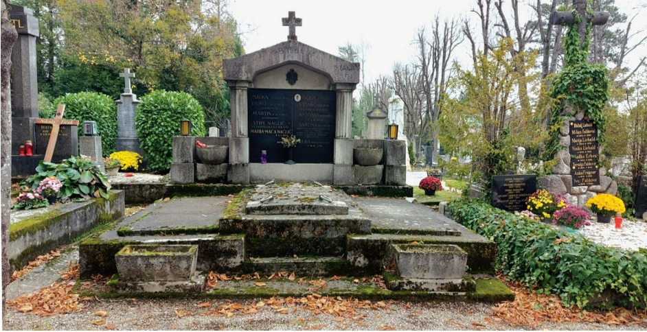
Slika 11. Grobnica u kojoj je pokopan Martin Vrkljan Pilarski