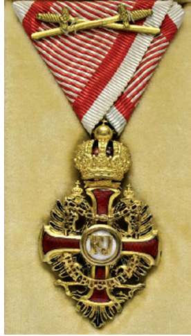
Slika 8. Časnički križ Reda Franje Josipa s ratnom dekoracijom