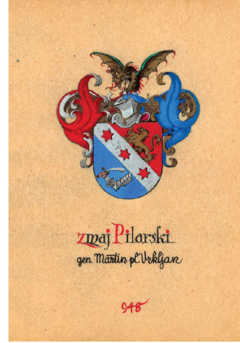
Slika 9. Zmajski grb Martina Vrkljanja Pilarskog