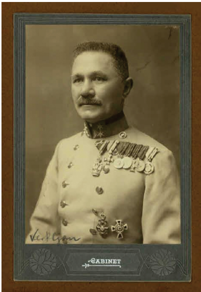
Slika 1. Podmaršal Martin Vrkljan od Pilara