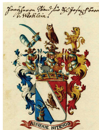
Slika 4. Barunski grb Josipa Vrkljana