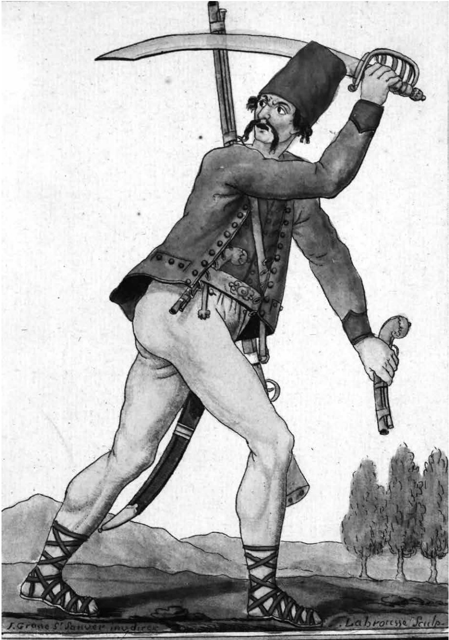
Mortague du Canton de Lara.