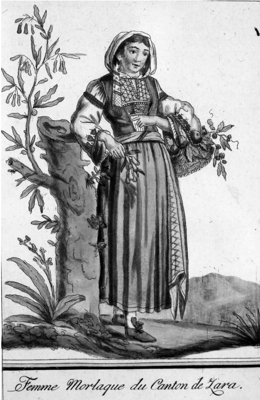
Fig. 1-2 - Morlacchi del Cantone di Zara (Collezione del Centro di ricerche storiche di Rovigno)