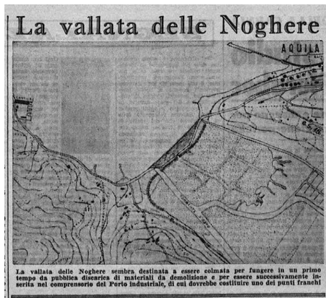
Fig. 6 – Il Piccolo – Giornale di Trieste , sabato 26 luglio 1958, n. 3641 n.s., p. 5 c. IV-VI

Alla fine degli Anni Cinquanta del 1900 si incomincia ad intravedere per la valle delle Noghere una destinazione industriale previo imbonimento del terreno paludoso delle ex Saline. Ne dava notizia Il Piccolo , nell'edizione del 26 luglio 1958 in una nota.