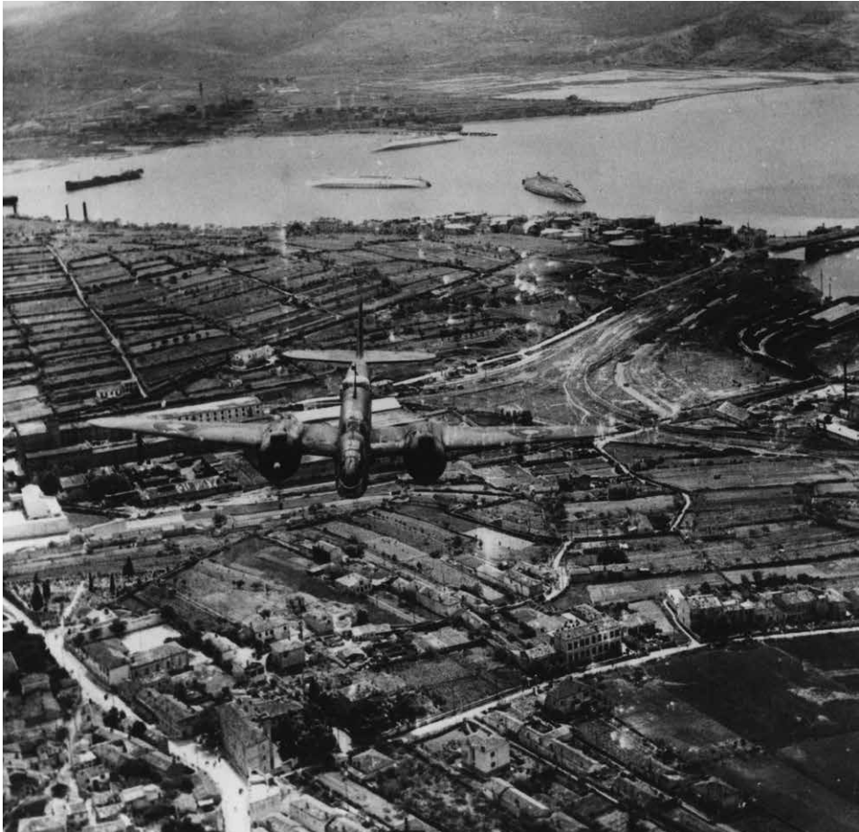
Fig. 4 - Il Vallone di Muggia in una foto del 10 giugno 1944. Sullo sfondo, in alto a destra, la Valle delle Noghere con ben visibile l'acquitrino delle ex saline. In primo piano il sorvolante bimotore inglese "Bristol Bleihaim".