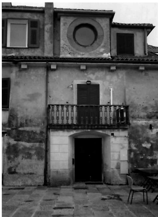
Fig. 7 - Edificio di largo Nazario Sauro, civici n.ri 7, 9 e 10; particolare della facciata nord

si può riconoscere anche con una elementare simulazione, sovrapponendo il prospetto dell'edificio come attualmente si presenta con quello del disegno del progetto veneziano, quale quella qui sotto riportata dove in tratteggio blu è riportata la sagoma dell'originario magazzino. E certamente non sfugge, anche all'occhio meno allenato a cogliere singolari caratteristiche costruttive, la particolarità architettonica che porta a riconoscere nell'edificio di largo Nazario Sauro, oggi contrassegnato dai numeri civici 7, 9 e 10 e benché modificato, il vecchio magazzino del sale di Muggia, perché appare evidente che non si tratta di un fabbricato di impianto, per così dire, comune; così come è evidente che la sua attuale configurazione è il risultato di successivi apporti e trasformazioni, che tuttavia hanno lasciato ben leggibile l'originario contesto, di cui l'elemento che di primo acchito e più di ogni altro attira l'attenzione è certamente la finestra circolare che si apre sulla facciata dell'abbaino, che si eleva dal tetto lungo la facciata dell'edificio rivolta a nord.