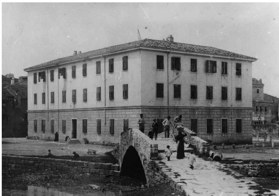
Fig. 4 - Il ponte de la Palù, visto da un'altra inquadratura, in una immagine dei primi anni del 1900. Oltre il ponte l'imponente edificio comunale, oggi civico n. 4 di Piazza Repubblica.

Le fasi di trasformazione dell'area de la Palù sono state oggetto di una ricostruzione plani-altimetrica ad opera di Mario Gasperini, i cui plastici, mirabilmente elaborati sulla base di cartografie e di corografie d'epoca, sono stati esposti in una mostra tematica organizzata dagli Assessorati all'Urbanistica e alla Cultura del Comune di Muggia in collaborazione con la Fameia Muiesana dal titolo Oggi e ieri. Fotografie a confronto sul Centro Storico ; mostra che si prefiggeva di evidenziare l'evoluzione della cittadina istroveneta sotto l'impatto di alcuni fattori determinanti quali l'avvio dei collegamenti, via mare e via terra, con Trieste e il sorgere di attività produttive e industriali quali il Cantiere San Rocco, il Cantiere Tonello, lo Squero Cadetti 39 .