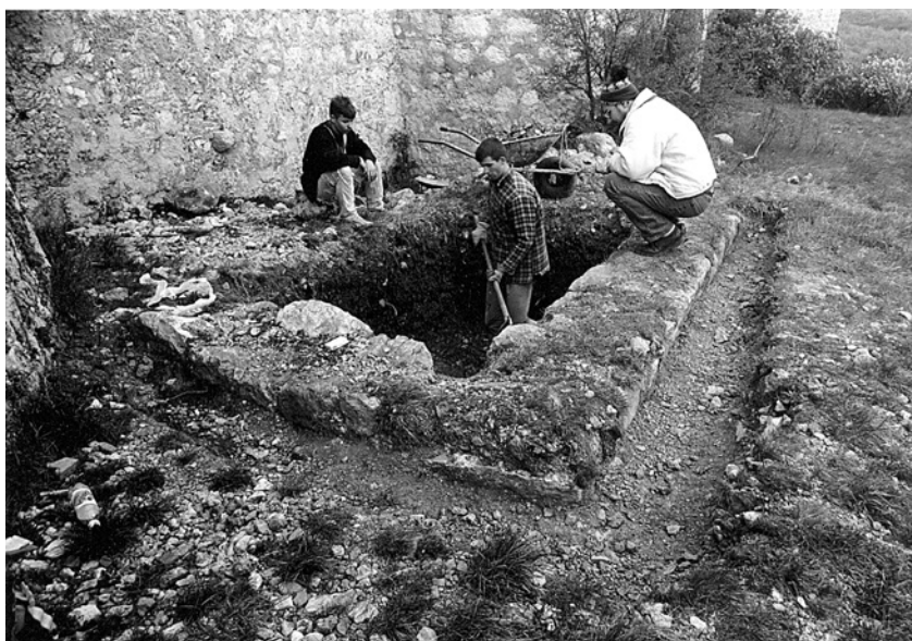
Drivenik 1999. – iskop sonde VI

kaštela. Zbog isteka vremena i novca probni iskop nije dovršen, odnosno nismo stigli do razine podnice. Sonda je iskopana do 110 cm dubine. Donjih pola metra nanosa ispunjavaju otpaci s ognjišta, kosti životinja, ulomci različitog posuđa te velika količina željeznih čavala i klinova. Našlo se tu i par ulomaka noževa, dlijeta i ručno svrdlo pa imamo dojam da je ovdje odbacivan kućanski otpad posade kaštela tijekom 16. i 17. stoljeća. Sami objekti bili su građeni usporedno s kaštelom, a predstavljali su pomoćne zgrade za potrebe samih graditelja, no količina otpada u njima jasno govori da su te prostorije napuštene već krajem 16. stoljeća. U gornjem dijelu sloja gruha i ognjišnih otpadaka uočena su tri mletačka bakrena novčića dosta izlizana od uporabe, od kojih su dva očuvanija i atribuirana. Jedan je novčić vrijednosti 12 solada kovan za dužda Giovannia Cornera između 1625. i 1629. godine, dok je drugi bio u opticaju za dužda Francesca Erizza između 1631. i 1646. godine. Pri dnu ovih objekata mogli bi se pronaći novčići iz vremena izgradnje utvrde.