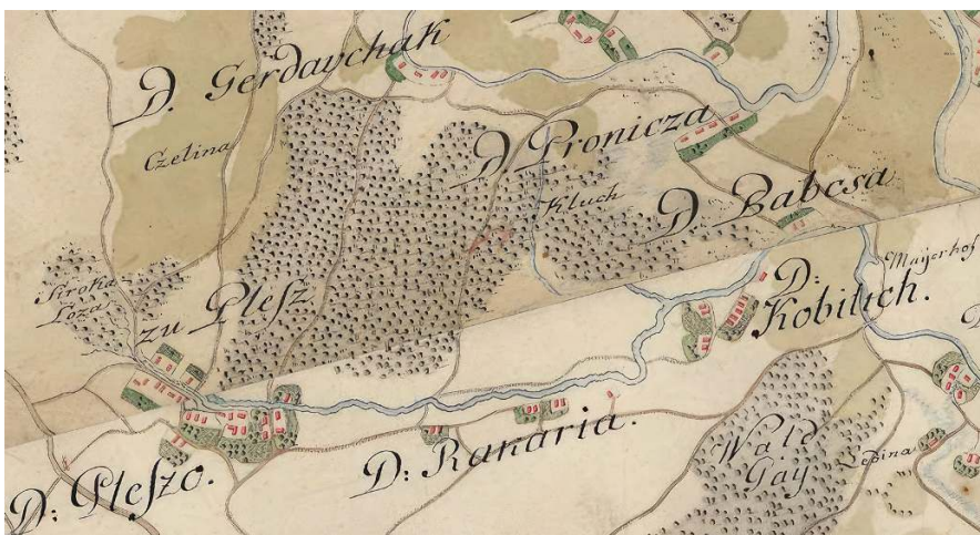
Slika 1. Izvorni smještaj sela Babcsa i Pronicza (danas Bapče ) oko 1782. 16 / Figure 1. Original location of the villages Babcsa and Pronicza (present-day Bapče ) around 1782

Što se hidronima Bapča tiče, on je posvjedočen prvi put 1550. kao fluviolus Babcza vocatus (MT III, 215) i 1552. kao terra iuxta fluvium Babcha in portu eiusdem fluvii Babcha (MT III, 293). Važna je ovdje jedna turopoljska, kajkavska isprava datirana 1848. godine, gdje se spominje taj potok. Tamo piše: [...] zarad napravljenoga na potoku Babchi proti Lazinam melina , a nešto niže u tekstu stoji na potoku Babcha zvanom [...] ter vu obchini Kobilich sztojechemu melinu... Tekst je napisao tadašnji župan turopoljski Albert Modić iz Donje Lomnice u Turopolju. 15 Ta je isprava važna jer upućuje na to da je ime potoka doista bilo Bapča , međutim, kao što ćemo vidjeti, to nema presudnu ulogu u donošenju zaključka jer smatramo da je ime potoka ionako sekundarno.