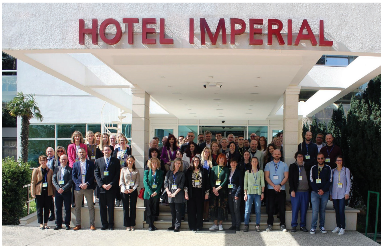
Slika 2. Sudionici 14. Simpozija HDZZ-a, Vodice, travanj 2025.