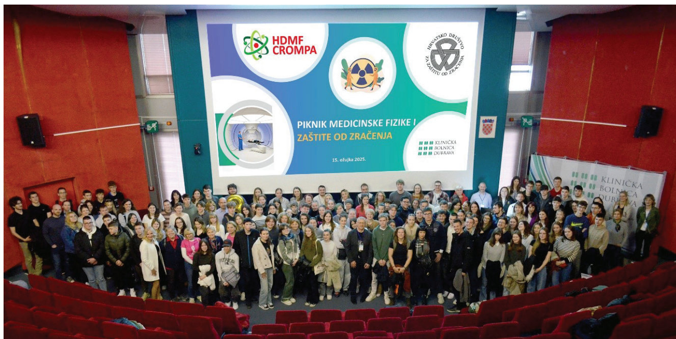
Slika 1. Sudionici 2. Piknika medicinske fizike i zaštite od zračenja, KB Dubrava, ožujak 2025.