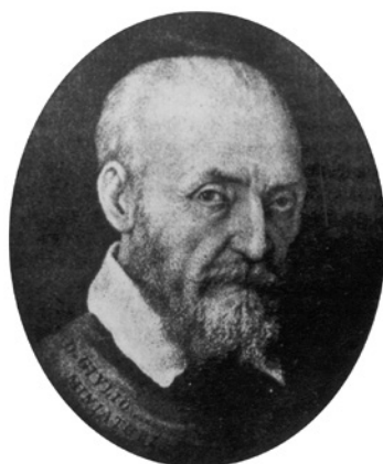
Don Julio Clouio

O Jurju Juliju Kloviću, sitnoslikaru, rođenom u Grižanama u Vinodolu, mnogo je toga napisano iz pera domaćih i stranih autora, o čemu svjedoči bogata bibliografija. Međutim, široj javnosti manje su poznati izvorni dokumenti koji govore više o njemu osobno, nastali u njegovo doba i poslije njega, razasuti po različitim arhivima u svijetu i raznim publikacijama.