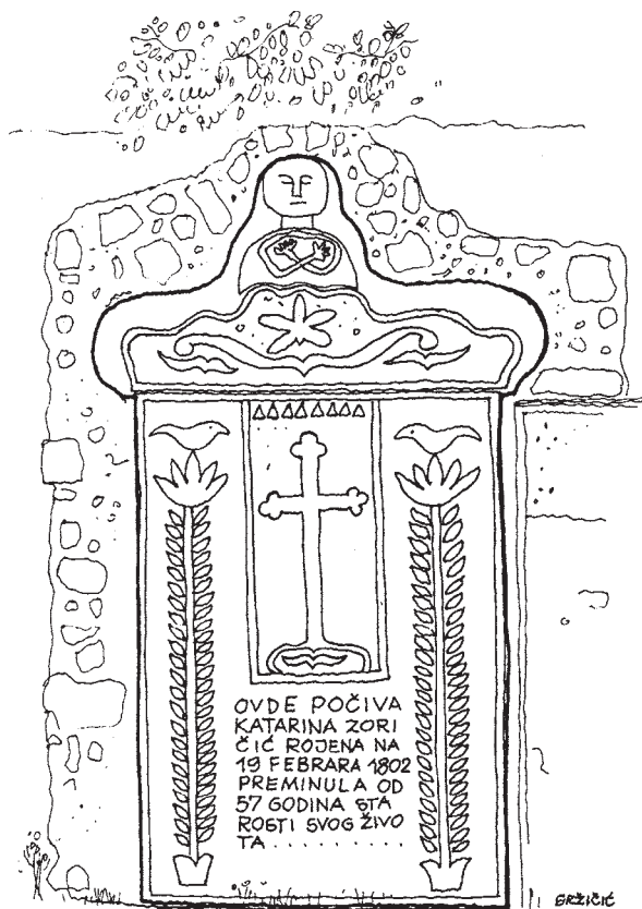
Spomenik na crikveničkom groblju

Vrlo je interesantno pratiti razvoj Crikvenice kao naselja u razvitku kroz njezina groblja kojih više nema.