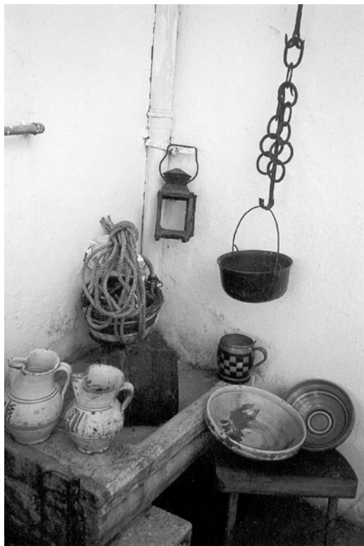
Dio etno zbirke

Za postilju se rabilo tri vrsti pokrivala tkanih od domaće vuni: debela bela ponjava, debelo i grubo tkani gunj i barakan ili biljac, tanoga tkanja i različito ofarban. Kušini su najviše bili napunjeni perin od domaćih kokoš. Priko postilje pokrivala se koltra, ukrasno tkana od domaće vuni ili lana, a va novije vrime štikana ili heklana. Složena roba po vrsti i boji zvala se «gib» i to je bila najveća vridnost va kući. Gospodarica kuće slagala je su bolju robu i bila je jako dična ako je imela peču lanenog platna (oko 40 m) za dotu kćeran. Kad bi prišal va kuću niki koga je familija štimala obavezno se pokazivala roba, posebno belina, zač je roba bila dika kuće. Belina se nigda držala va škri-nji, a pojavun bora drži se va njen. Boro ima tri do četiri škabelina va kih je uredno složena poštirvana speglana bela roba.