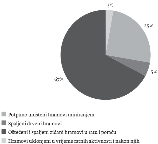
Graf I. Objekti po kategoriji oštećenja