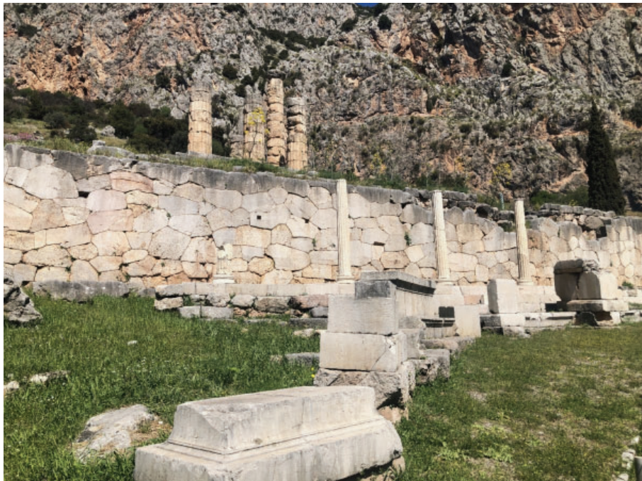
Slika 18. Stoa, ili otvoreni, natkriveni trijem, postavljen je otprilike u smjeru istok-zapad duž podnožja poligonalnog zida koji zadržava terasu na kojoj se nalazi Apolonov hram. Ne postoje arheološki dokazi o povezanosti s hramom. Stoa se otvorila prema Svetom putu. Prisutnost riznice Atenjana u blizini sugerira da je ova četvrt Delfa bila korištena za atenske poslove ili politiku, budući da se stoe općenito nalaze na tržnicama. Iako je arhitektura u Delfima uglavnom dorska, jednostavnog stila, u skladu s fokijskom tradicijom koja je bila dorska, Atenjani nisu preferirali dorski stil. Stoa je izgrađena u njihovom stilu, jonskom, a kapiteli stupova su siguran pokazatelj. Natpis na stilobatu pokazuje da su ga sagradili Atenjani nakon svoje pomorske pobjede nad Perzijancima 478. pr. Kr., kako bi u njemu smjestili svoje ratne trofeje. U to su vrijeme Atenjani i Spartanci bili na istoj strani. ( https://en.wikipedia.org/wiki/Delphi , 12.8.2024.)