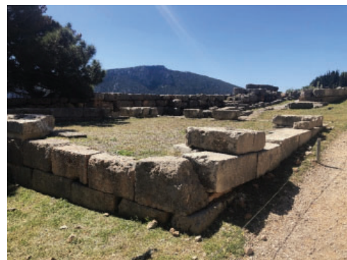
Slika 13. Jedna od početnih riznica duž svetog puta.

Od samog ulaza u nalazište, pa uz padinu skoro do samog hrama, nalazi se veliki broj votivnih ili zavjetnih kipova i brojne riznice. Njih su podizale razne grčke države, kako prekomorske, odnosno kolonije, tako i one s grčkog kopna, da bi obilježile pobjede i zahvalile se proročistu za korisne savjete. Najimpresivnija je danas restaurirana Riznica božice Atene, koja je podignuta u znak sjećanja na atensku pobjedu u Maratonskoj bitci. Atenjanima je proročica također savjetovala da imaju vjeru u svoje "drvene zidove". Atenjani su to shvatili