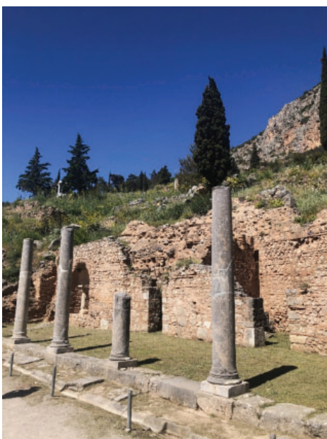
Slika 12. Prvi skup ostataka koje posjetitelj vidi nakon ulaska u arheološko nalazište je rimska Agora, koja se nalazila odmah izvan peribolosa, ili vanjskih zidina svetišta. Rimska Agora sagrađena je između svetišta i Kastalijskog izvora, otprilike 500 metara dalje. Ovaj veliki pravokutni popločani trg nekada je bio okružen jonskim trijemovima sa svoje tri strane. Trg je nastao u rimsko doba, ali danas vidljivi ostaci duž sjeverne i sjeverozapadne strane potječu iz kasnoantičkog razdoblja. Uz nju je vjerojatno bila osnovana otvorena tržnica na kojoj bi posjetitelji kupovali zavjetne poklone kao ponudu bogovima. Također je služio kao okupljalište za procesije tijekom svetih svetkovina. Za vrijeme Carstva ovdje su podizani kipovi careva i drugih značajnih dobročinitelja, o čemu svjedoče preostala postolja. U sklopu agore nastaju i kasnoantičke radionice brojnih obrtnika.

Od samog ulaza u nalazište, pa uz padinu skoro do samog hrama, nalazi se veliki broj votivnih ili zavjetnih kipova i brojne riznice. Njih su podizale razne grčke države, kako prekomorske, odnosno kolonije, tako i one s grčkog kopna, da bi obilježile pobjede i zahvalile se proročistu za korisne savjete. Najimpresivnija je danas restaurirana Riznica božice Atene, koja je podignuta u znak sjećanja na atensku pobjedu u Maratonskoj bitci. Atenjanima je proročica također savjetovala da imaju vjeru u svoje "drvene zidove". Atenjani su to shvatili