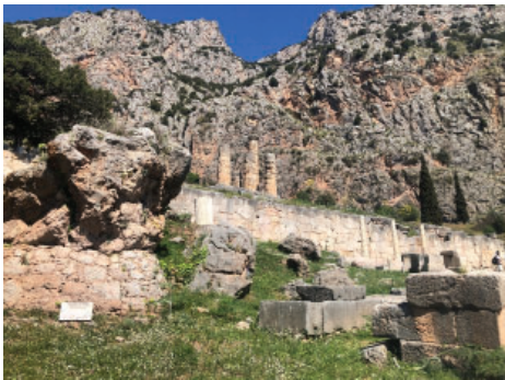
Slika 17. Između atenske riznice i stoe nalazi se Stijena sibila poput propovjedaonice. Legenda govori da je stijena mjesto s kojeg je pretpovijesna Sibila, koja je prethodila Apolonovoj Pitiji, sjedila kako bi izgovarala svoja proročanstva.