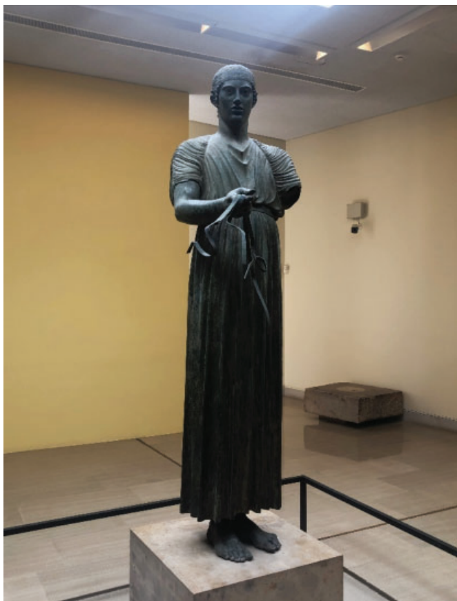
Slika 22. Skulptura Kočijaša iz Delfa najpoznatiji je izložak u Arheološkom muzeju u Delfima.

Rimska vladavina u Grčkoj označava postupni pad moći Apolonovog svetišta u Delfima. Pojedini rimski vojskovođe i vladari, poput Sule i Nerona, opljačkali su samo svetište, a potpunu propast proročišta omogućio je car Teodozije I., koji je 392. naredio da se hramovi zatvore, a igre zabrane. One su se, prema Pindaru, održavale svake osme godine i više su bila glazbena nego sportska događanja. U 6. st.pr.Kr. igre su reorganizirane, uvedena su atletska natjecanja i od tada se održavaju svake četvrte godine baš kao i olimpijske, nemejske, istamske i panatenejske igre.