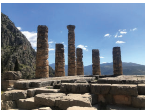
Slika 19. Odmah do Apolonovog hrama nalazi se Oltar Hiosa, koji je bio glavni oltar Apolonovog hrama. Izgrađen je nakon rekonstrukcije hrama 330-ih pr.Kr., zamijenivši stariji oltar iz vremena Alkmeonida. Žrtvenik iz 4. st.pr.Kr. posvetili su ljudi s Hiosa, o čemu govori natpis na lijevoj strani njegove krune. Oltar se sastoji od jezgre izrađene od vapnenca i obložene pločama plavkastog mramora. Žrtveni stol bio je od bijelog mramora i na njega su se svećenici vjerojatno penjali stubištem. Spiralni ukrasni elementi flankiraju gornji dio oltara, koji je također okrunjen cimatičem. Prema novijim istraživanjima spomenik datira u 3. st.pr.Kr., vjerojatno nakon 246./245. pr.Kr., kada je otok Hios postao član Amfiktionije. ( https://en.wikipedia.org/wiki/Altar_of_the_Chians , 12.8.2024.)