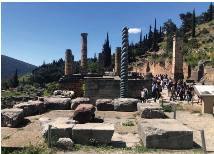
Slika 20. Ruševine Apolonovog hrama koje su danas vidljive potječu iz 4. st.pr.Kr. i predstavljaju periptersku dorsku građevinu. Podigli su ga Spintar, Ksenodoros i Agaton. Desno od hrama je četvrtasto postolje spomenika u čast bitinijskog kralja Prusija II. Ukupna visina spomenika dosegla je 9,70 metara. Na vrhu je stajao kip kralja Prusije na konju. Spomenik je bio sličan pijedestalu spomeniku Emilija Paula, postavljenom oko 15 godina kasnije južno od ulaza u Apolonov hram, koji je danas izložen u Arheološkom muzeju u Delfima. ( https://en.wikipedia.org/wiki/Monument_of_Prusias_II , 12.8.2024.) Ispred Oltara Hiosa i Apolonovog hrama nalazi se brončana replika Zmijskog stupa izgrađenog kao žrtva Apolonu 447. pr. Kr. Godine 324. car Konstantin Veliki premjestio ga je na hipodrom u Konstantinopolu. Izgrađen je u spomen na Grke koji su se borili i porazili Perzijsko carstvo u bitci kod Plateje (479. pr. Kr.).