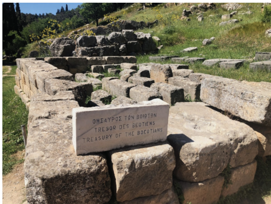
Slika 14. Riznica Beočana posvećena je u kasnom arhajskom razdoblju unutar svetišta Apolona u Delfima. Identificirana je prema epigrafskom materijalu pronađenom na tom mjestu (natpisi u beotskom stilu kasnog arhajskog pisma). Temelji ove riznice nalaze se pri jugozapadnom kraju Svetog puta. Pausanija ne spominje tu građevinu, pa je moguće da je uništena u njegovo vrijeme. Sačuvani arhitektonski dijelovi upućuju na to da se radilo o dorskoj građevini od vapnenca. Prema sačuvanim natpisima, zgrada je datirana oko 525. pr.Kr.

Sifnijsku riznicu posvetio je grad Sifnos, čiji su građani davali desetinu od uroda svojih rudnika srebra sve dok rudnici nisu naglo prestali kad je more poplavilo radove. Jedna od najvećih riznica bila je ona grada Argosa. Dovršena 380. pr. Kr., čini se da njihova riznica podignuta po uzoru na Herin hram u Argolidi. Međutim, novija analiza arhajskih elemenata riznice sugerira da je njezino osnivanje prethodilo tome.