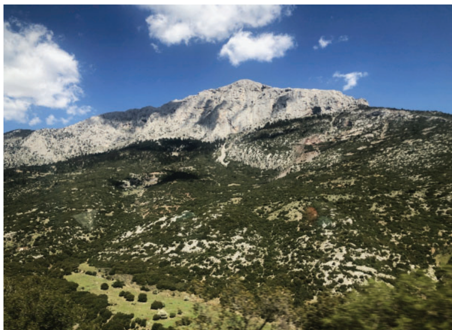
Slika 3. Planina Parnas po pričama iz grčke mitologije bila je posvećena bogu Apolonu, ali i Korikijskim nimfama. Na ovoj planini je Apolon dao Orfeju zlatnu liru i naučio ga svirati, tu je bio dom i bogova Dioniza i Pana, krilatog konja Pegaza i Muza, Zeusovih kćeri i zaštitnica znanosti i umjetnosti. Danas se na ovoj planini nalazi najveće skijaško središte u Grčkoj.

Delfi (grčki: Δελφοί), u legendi prethodno nazvani Pito (grčki: Πυθώ), bili su drevno antičko sveto područje i sjedište Pitije te glavno proročište stare Grčke koje je bilo često posjećivano zbog donošenja važnih odluka u cijelom starom klasičnom svijetu. Danas se tako zove jedna grčka općina i gradić sagrađen za stanovnike sela Kastri. Srednjovjekovno naselje je bilo podignuto na samom arheološkom nalazištu čiji su se mramorni stupovi i drugi kameni elementi koristili kao besplatan kamenolom za izgradnju tamošnjih građevina. Ovakav način gradnje je bio uobičajen u naseljima koja su bila dijelom ili potpuno uništena, a takvih primjera ima mnogo i na području današnje Hrvatske. Arheolozi iz École française d'Athènes (Francuska škola iz Atine) su 1893. pronašli mjesto na kojem su se nalazili antički Delfi, pa je selo koje se tada tu nalazilo premješteno zapadno od lokacije hramova da bi se mogla vršiti arheološka istraživanja antičkog naselja.