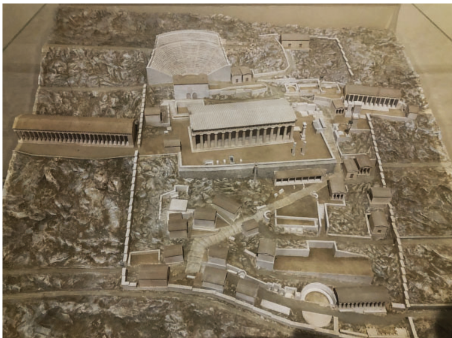
Slika 8. Rekonstrukcija Apolonovog svetišta u Delfima iz Delfijskog muzeja.