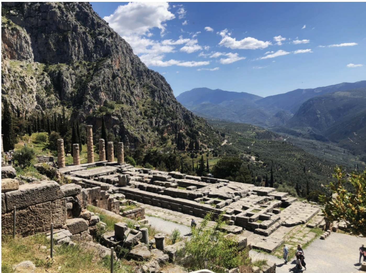
Slika 1. Apolonovo proročište u Delfima. Na slici se nalazi kompleks Apolonovog hrama.