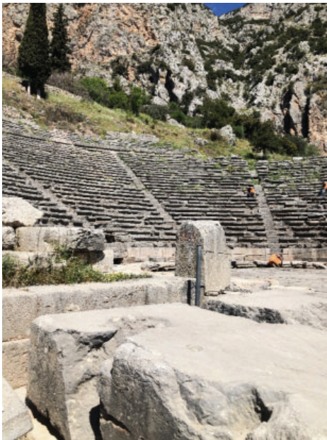
Slika 2. Kazalište u Delfima sagrađeno je oko 400. pr. Kr. Od parskog kamena na mjestu ranijeg drvenog kazališta. Primalo je oko pet tisuća gledatelj.

zani uz zdravlje i bolesti, zločine i kazne, rješenja ustavnih i pravnih problema tražili su potvrdu proročica i mišljenje bogova, pa su proročišta dobivala velike darove. U Delfima je postojalo čak šesnaest građevina koje su služile za pohranu blaga koje su proročištu darivali pojedini grčki polisi. Polisi su se natjecali u količini darova čime su pokazivali svoju moć, ali i željeli udobrovoljiti bogove.