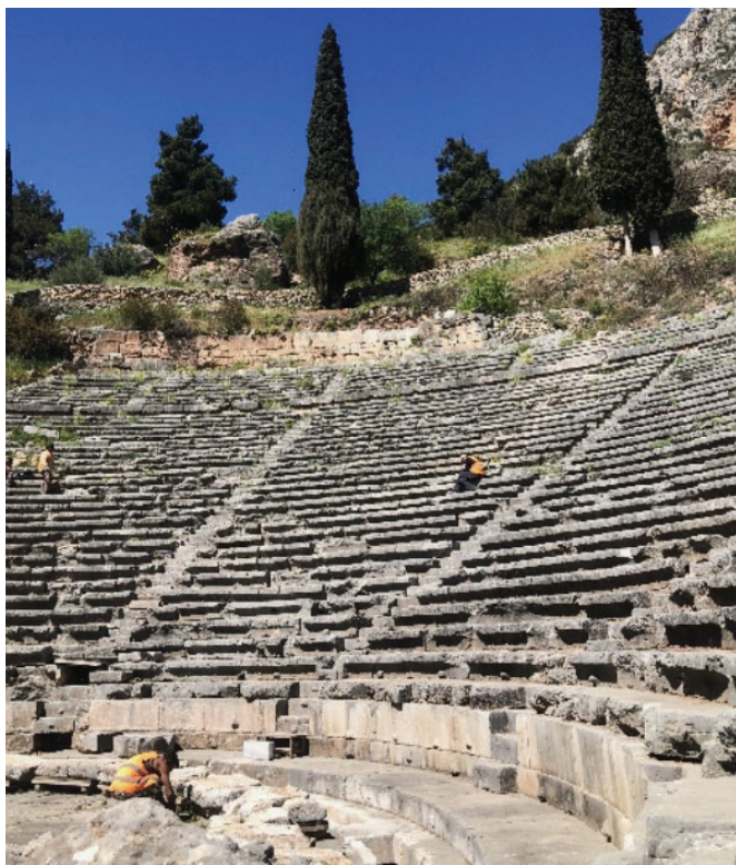
Slika 21. Na vrhu arheološkog kompleksa nalaze se kazalište i stadion. Do stadiona, na kojemu su se održavale Pitijske igre, nisam mogao zbog radova. Stari amfiteatar izgrađen je na brdu iznad Apolonovog hrama. Ova lokacija pruža pogled na cijelo svetište i dolinu. Prvobitno je izgrađen u 4. st.pr.Kr., a kasnije je doživio nekoliko preinaka. Ima 35 redova i može prihvatiti oko 5.000 gledatelja. ( https://bs.wikipedia.org/wiki/Delfi , 12.8.2024.)