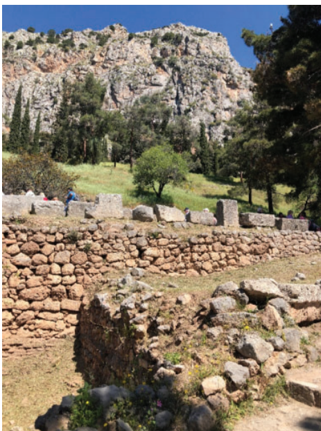
Slika 11. Fedrijadele su dvije litice visoke oko 700 metara i nalaze se na donjem dijelu južne padine Parnasa. Antički povjesničari Strabon, Plutarh i Pausanija spominju ove stijene kada opisuju Delfe. Plutarh je dugo godina i sam bio svećenik u Delfima i tumačio proročanstva. Fedrijadele znači "blistave stijene" (grčki: Φαιδριάδες, engl. Phaedriades). Delfski sveti izvor, odnosno izvor potoka Kastalija, nalazi se u klanecu između ovih stijena. Na ovom mjestu nalaze se preostali ostaci dviju monumentalnih fontana koje su dobivale vodu s ovog izvora. Datičaju iz arhajskog razdoblja. Rimljani su kasnije usjekli fontanu u stijeni.