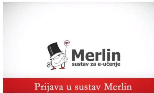
Slika 2. Merlin, platforma za e-učenje (Sveučilište u Zagrebu; Sveučilišni računski centar)