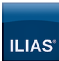
Slika 3: Oznaka odnosno logo LMS sustava ILIAS

ILIAS je još jedan popularan sustav za e-učenje (LMS) koji se koristi u različitim sektorima, uključujući obrazovanje, korporativno okruženje i vojnu obuku. Kao „open-source“ platforma, ILIAS nudi fleksibilnost i prilagodljivost u organizaciji digitalnih tečajeva, kao i napredne funkcije za praćenje napretka korisnika. ILIAS je besplatan za preuzimanje i korištenje, iako zahtijeva tehničke resurse za implementaciju i održavanje. ILIAS koristi modularni dizajn, što znači da se sustav može prilagoditi različitim potrebama organizacije. Uključuje module za upravljanje učenjem, suradnju, komunikaciju, ocjenjivanje i praćenje napretka. ILIAS je kompatibilan s najpopularnijim e-learning standardima, uključujući SCORM i xAPI (Tin Can API) 3 , što omogućava lako integriranje interaktivnih materijala i praćenje aktivnosti korisnika. ILIAS omogućava stvaranje virtualnih učionica s podrškom za videokonferencije, čime podržava sinkrono učenje u stvarnom vremenu. Platforma nudi snažne alate za praćenje i izvještavanje o napretku učenika, uključujući mogućnosti generiranja detaljnih statistika i ocjena. ILIAS je popularan u vojnom obrazovanju zbog svoje visoke razine sigurnosti i mogućnosti hostinga na privatnim serverima, što omogućava kontrolu nad osjetljivim podacima.