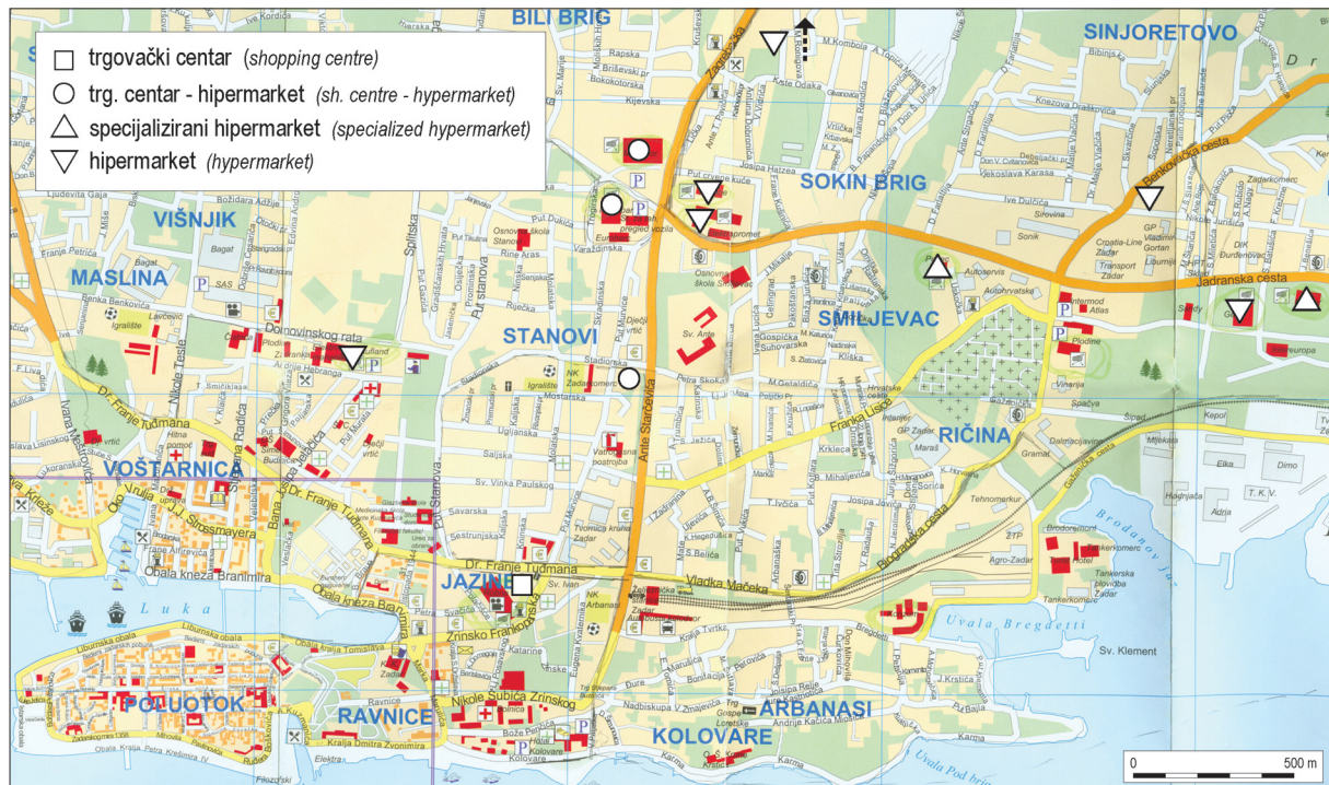
Slika 3. Lokacija kupovnih centara u Zadru do kolovoza 2007. godine Figure 3 Location of retail centres in Zadar August 2007