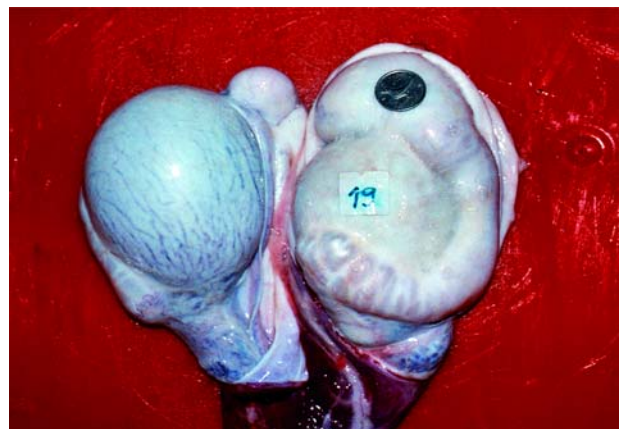
Slika 1. Ovcji epididimitis uzrokovan s B. ovis . Vidljiva je atrofija lijevog testisa – kronični epididimitis Figure 1. Epididymitis in a ram caused by B. ovis . Atrophy of the left testicle is evident – chronic epididymitis

Nakon izdvajanja i identifikacije Brucella sp. klasičnim bakteriološkim postupcima, vršila se i identifikacija metodom lančane reakcije polimerazom. U svih izdvojenih izolata iz različitih vrsta životinja i ljudi dokazana je pripadnosti rodu Brucella spp. tj. svi pripadnici roda Brucella ovom pretragom su identificirani prema specifičnom produktu umnažanja veličine oko 440 bp. U drugoj fazi identifikacije dokazana je pripadnosti različitim vrstama roda Brucella .