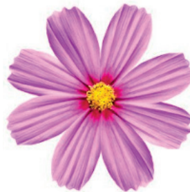
Slika 5. Rotacijom oko središta cvijet se preslikava u istu sliku