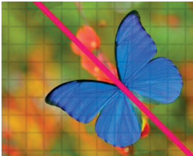
Slika 4. Leptir ima osnu simetriju jer su mu krila zrcalno jednaka s obzirom na pravac

U simetričnim uzorcima elementi ponavljanja se ne razvijaju linearno, nego se jednakost može uočiti kada se uzorak presavije ili okrene. Razlikuju se s obzirom na vrstu simetrije. Predmet ima osnu simetriju ukoliko ostaje jednak nakon zrcaljenja, odnosno ukoliko os simetrije (pravac) dijeli oblik na dva sukladna dijela kao što su krila leptira ( Error! Reference source not found. ). Predmet ima rotacijsku simetriju ako u ravnini postoji rotacija objekta oko neke točke (centra rotacije) kojom se taj objekt preslika sam na sebe kao što su latice cvjetova ( Error! Reference source not found. ), snježna pahulja, morska zvijezda i slično.