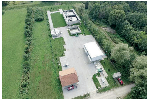
Slika 3: UPOV aglomeracije Donji Kraljevec