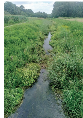
Slika 4: Potok Bistrec-Rakovnica

onečišćenja vode i planiranje učinkovitih strategija prevencije i redukcije (Odjadjare i Okoh 2010; Singh i sur. 2023).