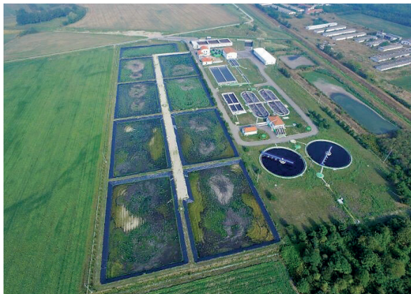
Slika 1: UPOV aglomeracije Čakovec