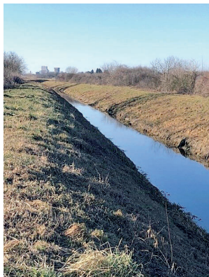
Slika 2: Potok Trnava