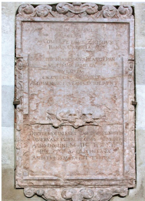
Natpis na crkvi u Bečkom Novom Mjestu

protiv habsburškog apsolutizma uhićeni su, osuđeni, pogubljeni i pokopani 1671. u Bečkom Novom Mjestu. Spomenuta rečenica dio je teksta na nadgrobnom natpisu koji se danas nalazi na vanjskom zidu župne crkve u Bečkom Novom Mjestu.