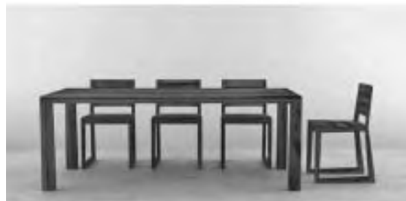
Slika 12. Basic . Dizajn: Grupa - studio za industrijsko i grafičko oblikovanje - Filip Despot, Tihana Gotovuša, Ivana Radovanović; naručitelj: Artisan, Tešanj, BiH, 2007. (počasno priznanje za produkt / industrijski dizajn u profesionalnoj kategoriji)

za strane naručitelje (slika 12 i 13) ili je rezultat samoinicijativnih akcija bez poticaja naručitelja. Asortiman drvenog namještaja Basic primjer je kako se namještaj od drva može oblikovati vizualno jednostavno, domišljato, elegantno i profinjeno, uz naglašena ergonomska rješenja te ručnu doradu koja daje poseban dojam unikatnog. Kolekcija je namijenjena proizvodnji u malim serijama i po narudžbi. Rustikalnoj toplini oraha, hrasta, javora ili trešnje suprotstavljene su minimalističke linije dizajna s detaljima urezanim u korpus elementa. To je primjer kako je nebrojeno puta naša kreativnost prepoznata u drugim državama.