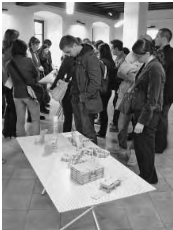
Slika 1. Studenti i nastavnici u posjetu izložbi BIO 21 u Ljubljani

Te dizajnerske događaje obišli su nastavnici i studenti Drvnotehnološkog odsjeka Šumarskog fakulteta (sl. 1), pri čemu su imali priliku uočiti razlike, ali i sličnosti u razmišljanju profesionalaca i studenata dizajna u kategorijama industrijskog dizajna, vizualnih komunikacija i mode. Na obje izložbe prikazani su proizvodi i ideje te koncepti u gotovo svim navedenim kategorijama.