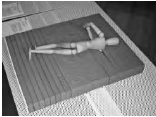
Slika 2. Love Mattress . Dovrtljivo konceptualno rješenje madraca. Dizajn: Mehdi Mojtabavi, Teheran, Iran, 2007.

Izložci su bili raspoređeni na dva kata Dvorca Fužine, a nekolicina njih dobila je pravo značenje tek iščitavanjem naziva rada ili obrazloženjem rješenja koje se nalazilo uz rad. Ono što je posjetitelja moglo privući svakom radu (a autorice ovog teksta redovito i jest) jesu neobično oblikovno rješenje, drugačija uporaba materijala nego što smo navikli ili na prvi pogled nedefinirana funkcija proizvoda. Ove godine pozornost nisu privlačili „veliki predmeti“ već, dapače, brojni mali proizvodi od kojih nam se sastoji svakodnevni život – počevši od višenamjenske posude za voće ili osobne „sitnice“ od neočekivanog materijala, uporabno i kulturološki neobičnoga, ali ergonomski izuzetnog