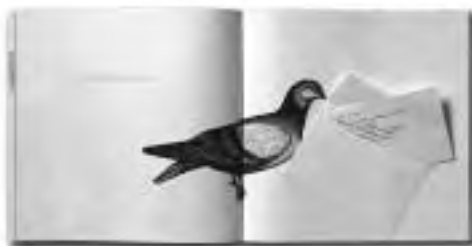
Slika 4. Brošura 40ish listova papira. Dizajn: Studio Cuculić, Zagreb, Hrvatska; tisak: Kratis, d.o.o., Zagreb; naručitelj: Igepa Plana Papiri d.o.o., Zagreb, Hrvatska, 2007. (Zlatna medalja BIO).