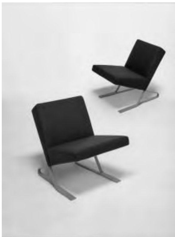
Slika 13. Satyr , sustav fotelja s čeličnim, lakiranim ili kromiranim nogama, sa sjedalima i naslonima od ojaštucene furnirske ploče. Dizajn: For Use/Numen - Sven Jonke, Christoph Katzler, Nikola Radeljković; naručitelj: ClassiCon, München, 2006.

Ipak, da suradnja između proizvođača i dizajnera može donijeti obostrani uspjeh i biti na obostranu korist potvrđuje nekoliko zanimljivih projekata prikazanih na izložbi, i to u rasponu od dizajna traktora, preko namještaja sve do jahti i jedrilica.