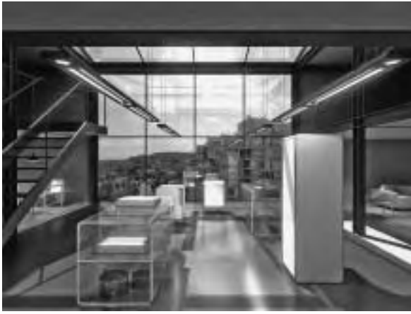
Slika 5. Qube White , alternativni asortiman samostojećih kućanskih aparata. Dizajnerica: Tina Jerbarek, Gorenje design studio, d.o.o., Ljubljana; naručitelj: Gorenje, d.d., Velenje, Slovenija, 2007. (Dobar dizajn BIO )