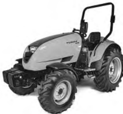
Slika 14. Tuber 40 . Dizajn: Tomislav Jelić, Tomislav Kraljević; naručitelj: Labinprogres, Labin, 2008. (počasno priznanje za produkt / industrijski dizajn u profesionalnoj kategoriji)

Da traktor može izgledati simpatično i humanije, a ne nezgrapno i glomazno kako smo navikli, dokazuje rad Tuber 40 dizajnera Tomislava Jelića i Tomislava Kraljevića (sl. 14). U tom primjeru nije zanimljivo samo spomenuti kako je tvrtka Labinprojekt iz Istre prije nekoliko godina „imala hrabrosti“ angažirati te dizajnere u osmišljavanju vlastitih proizvoda – poljoprivredne mehanizacije, već je prava zanimljivost da je nedavno, na dodjeli nagrada za najbolji menadžment dizajna u Cardiffu (UK), tvrtka nagrađena počasnim priznanjem za menadžment dizajna u kategoriji velikih tvrtki Europe. Nagradu je dobila upravo za projekt Tuber 40 koji je i na 0708 dobio počasno priznanje za produkt / industrijski dizajn u profesionalnoj kategoriji.