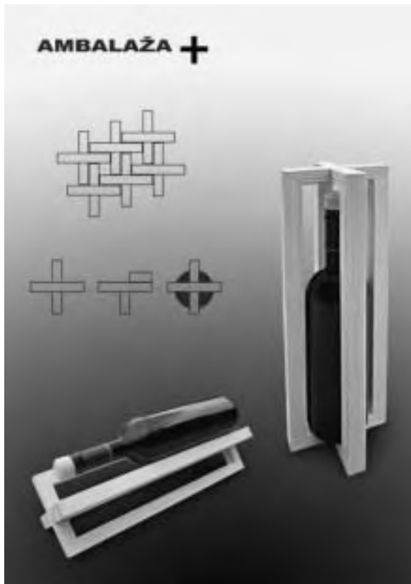
Slika 10. Ambalaža + , praktična drvena konstrukcija ambalaže. Dizajn: Antonio Šunjerga; naručitelj: Obiteljsko gospodarstvo Šunjerga, 2008.