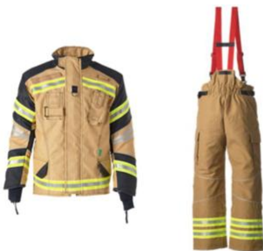
Sl.3 Dvodijelno vatrogasno odijelo (jakna i hlače) za gašenje strukturnih požara tvrtke MSA [14]

Na sl.3 prikazano je dvodijelno odijelo (jakna i hlače) tvrtke MSA namijenjene zaštiti tijela vatrogasca prilikom gašenja strukturnih požara. S obzirom da se sastoji od dva dijela, između istih mora postojati dovoljan preklop u svim radnim položajima (najčešće 30 cm) [4]. Odijela se u pravilu sastoje od tri ili četiri sloja koja čine: