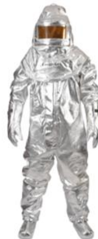
Sl.5 Reflektirajuće odijelo za posebna gašenja požara tvrtke IST [24]