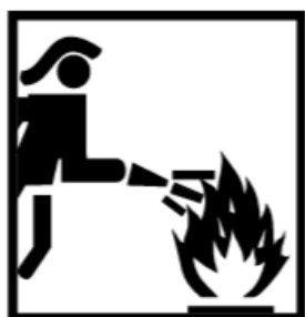
Sl.2 Piktogram vatrogasne intervencijske odjeće prema normi HRN EN ISO 13688 [7]

Za sve tri osnovne podgrupe označavanje se izvodi sukladno normi HRN EN ISO 13688. Pripadajući piktogram za ove odjevne predmete dan je na sl.2.