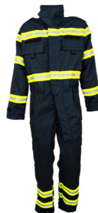
Sl.4 Kombinezon za gašenje požara otvorenog prostora tvrtke Hemco d.o.o. [21]

Ovaj tip zaštitne odjeće kao i odjeća za zaštitu od strukturnih požara, također može biti u obliku kombinezona ili dvodijelan pri čemu mora u potpunosti pokrivati ljudsko tijelo i ne smije ograničavati izvođenje pokreta prilikom rada. Označavanje se izvodi sukladno normi HRN EN ISO 13688 uz navođenje broja i naziva norme, piktograma te razine postignutih performansi (A1, A2 ili obje razine) [4]. Osnovni zahtjevi koje materijali moraju ispuniti nalaze se u tab.2.