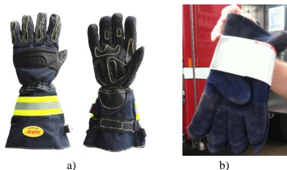
Sl.6 Rukavice za vatrogasce: a) rukavice od tekstilnih materijala tvrtke Hemco d.o.o. [21], b) kožne rukavice TechNote [29]