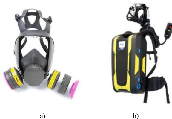
Sl.9 Osobna zaštitna oprema za zaštitu dišnih organa: a) cjeloobrazna maska s filtrom tvrtke Moldex-Metric Inc [38] b) samostalni uređaj za disanje BG ProAir tvrtke Dräger [39]

S obzirom na dio koji pokriva lice može biti: cjeloobrazna maska (pokriva dišne otvore, lice i oči), polumaska (polovični obrazni dio koji štiti nos i usta) te četvrtmaska (četvrtinski obrazni dio koji štiti nos i usta). Na sl.9a prikazana je cjeloobrazna maska s dva filtra za zaštitu od čestica. Maska je izrađena od prirodne gume kojom se osigurava prijanjanje uz kožu te time nepropusnost između maske i lica osobe koja ju nosi. Sastavni dio pune maske je vizir od akrila koji treba biti otporan na ogrebotine, ne smije se zamagljevati i rositi, a istovremeno treba pružiti široko vidno polje, sl.9a [7].