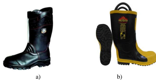
Sl.7 Vatrogasne čizme: a) kožne čizme tvrtke Vökl [33], b) gumene čizme tvrtke Harvik Rubber Industries Sdn Bhd [34]

S obzirom na materijal od kojeg je izrađena, vatrogasna obuća se dijeli u dva razreda: